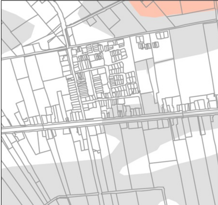
Uitsnede Archeologische waarden- en verwachtingenkaart

Anerweg en de oostzijde van Lutten. Voor deze gebieden is een dubbelbestemming opgenomen en gelden beperkingen bij grondverzet. Zie hiervoor de regels van deze beheersverordening.