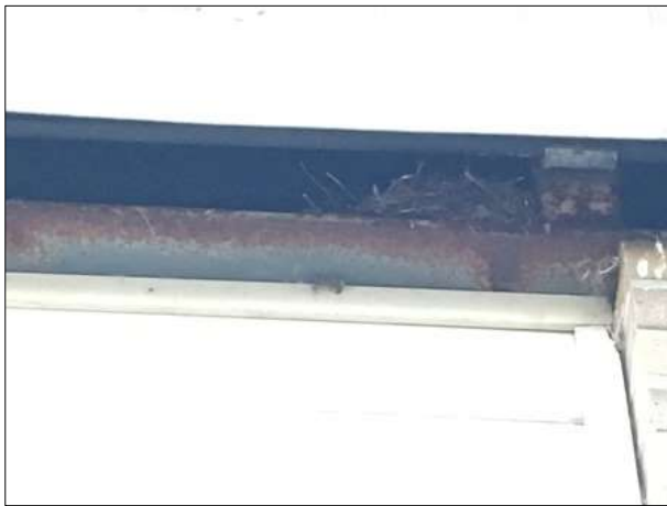
Nestplaats van de witte kwikstaart.

Het plangebied behoort tot functioneel leefgebied van verschillende vogelsoorten. Vogels benutten de buitenruimte van het plangebied als foerageergebied en er nestelen vermoedelijk jaarlijks vogels in het plangebied. Vogelsoorten die mogelijk in het plangebied nestelen zijn merel, houtduif, kneu, heggenmus, vink (allen in de beplanting) en witte kwikstaart (in de bebouwing). Er zijn tijdens het veldbezoek geen huismussen in het plangebied waargenomen. Gelet op de bouwstijl van de bebouwing, wordt het als een ongeschikte nestplaats voor de huismus beschouwd. Ook vormt het plangebied een ongeschikte nestplaats voor de gierzwaluw, steen- of kerkuil.