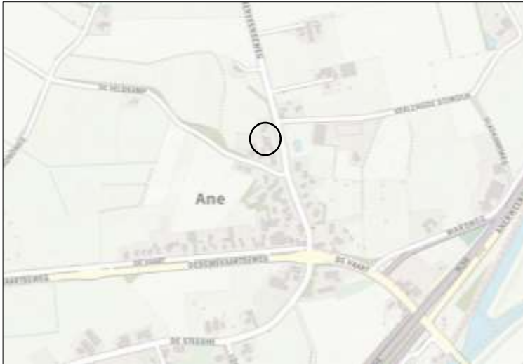
Globale ligging van het plangebied. De ligging van het plangebied wordt met de cirkel aangeduid.

Het plangebied is gesitueerd op het adres Anerveenseweg 14A te Ane. Het ligt in aan de rand van de buurtschap Ane. Op onderstaande afbeelding wordt de globale ligging van het plangebied weergegeven op de topografische kaart.