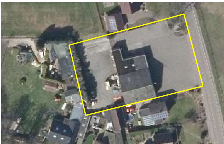
Detailopname en begrenzing van het plangebied. Het plangebied wordt met de gele lijn aangeduid.

Het plangebied vormt een voormalige bedrijfslocatie waar voorheen een transport bedrijf gevestigd was. Het plangebied bestaat uit erfverharding, bebouwing en een rij coniferen. De bebouwing in het plangebied bestaat uit een garage met aanbouw. De bebouwing is gebouwd van bakstenen en heeft een met bitumen gedekt plat dak. Met uitzondering van de meest recente aanbouw aan de noordzijde van de bebouwing, beschikt de bebouwing niet over een spouw. Op onderstaande luchtfoto wordt de ligging van het plangebied weergegeven. Voor een verbeelding van het plangebied wordt verwezen naar de fotobijlage.