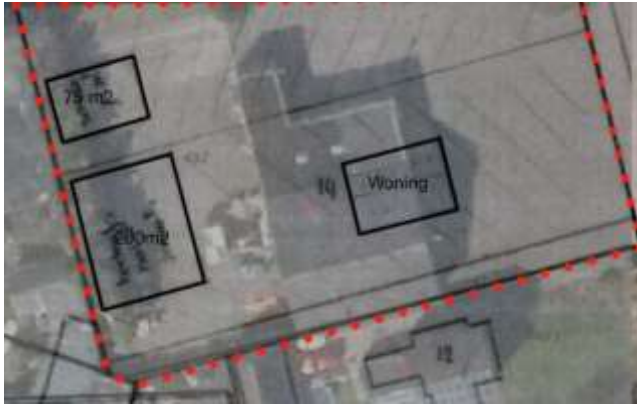
Verbeelding van het wenselijke eindbeeld.

Het concrete voornemen bestaat om een woning met bijgebouwen (2) in het plangebied te bouwen. Om de bouw van de woning en de bijgebouwen mogelijk te maken dient de aanwezige bebouwing gesloopt te worden. Op onderstaande afbeelding wordt het wenselijke eindbeeld weergegeven.