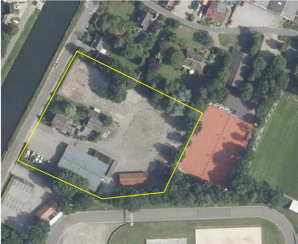
Detailopname van het plangebied. Het plangebied wordt met de gele lijn aangeduid.