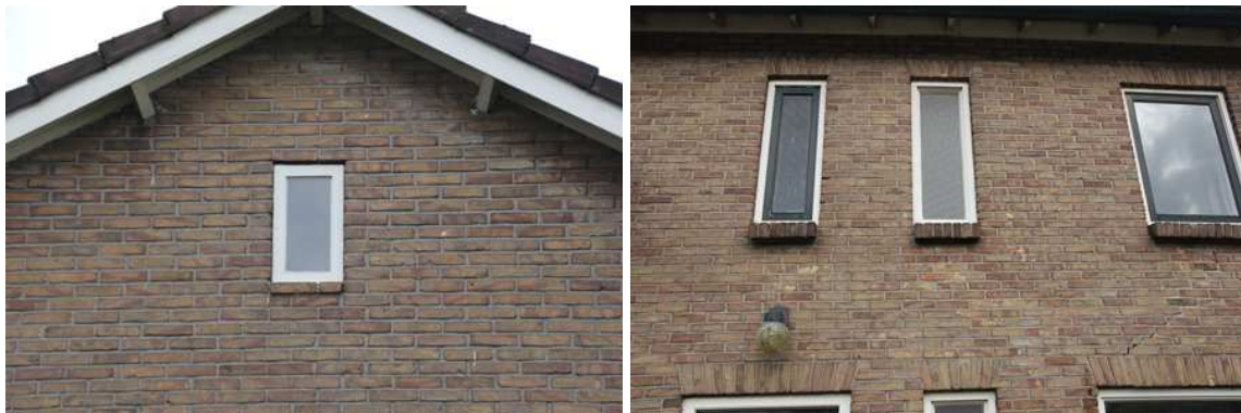
Aanblik op de buitengevel van de woning. In de gevel zijn geen open stootvoegen of andere potentiële invliegopeningen zichtbaar.

Er zijn in het plangebied geen vleermuizen waargenomen en er zijn geen aanwijzingen gevonden dat vleermuizen een vaste verblijfplaats in het plangebied bezetten. De bebouwing in het plangebied wordt als een ongeschikte verblijfplaats voor vleermuizen beschouwd. Potentiële verblijfplaatsen zoals gevelbetimmeringen, windveren, vensterluiken en een toegankelijke geïsoleerde zolder ontbreken. De woning beschikt vermoedelijk over een (holle) spouw, maar er zijn echter geen sporen gevonden die op de aanwezigheid van een verblijfplaats van vleermuizen in de spouw duiden, zoals uitwerpselen aan de muur nabij de invliegopening. In de buitenmuur zijn ook geen potentiële invliegopeningen waargenomen. Vaak benutten vleermuizen open stootvoegen om de (holle) spouw te bereiken.