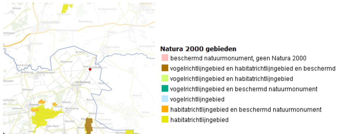
Ligging van Natura 2000-gebied nabij het plangebied. Het plangebied wordt met de rode marker aangeduid.

Het plangebied ligt niet in of direct naast Natura 2000-gebied. Gronden die tot Natura2000-gebied behoren liggen minimaal op 13 kilometer afstand van het plangebied. Op onderstaande afbeelding wordt de ligging van Natura 2000-gebied in de omgeving van het plangebied weergegeven.