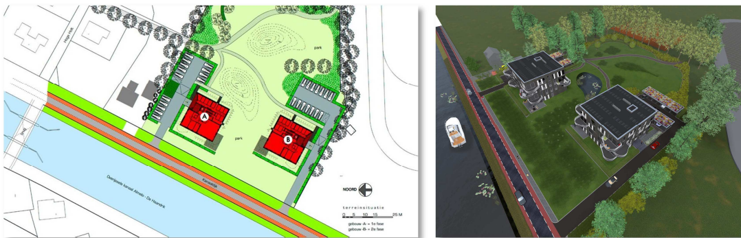
Plattegrond en een impressie van het wenselijke eindbeeld.