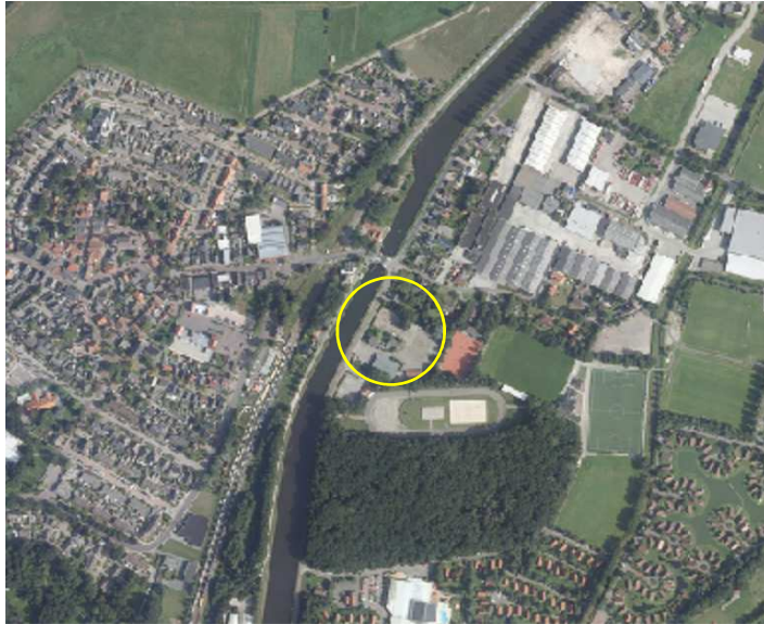
Globale ligging van het plangebied. De ligging van het plangebied wordt met de cirkel aangeduid.

Het plangebied is gesitueerd op het adres Kanaaldijk 3 in Gramsbergen. Het ligt oostelijk van de oude kern van Gramsbergen, direct ten oosten van het kanaal Almelo-De Haandrik. Op onderstaande kaart wordt de globale ligging van het plangebied aangeduid met de gele cirkel.