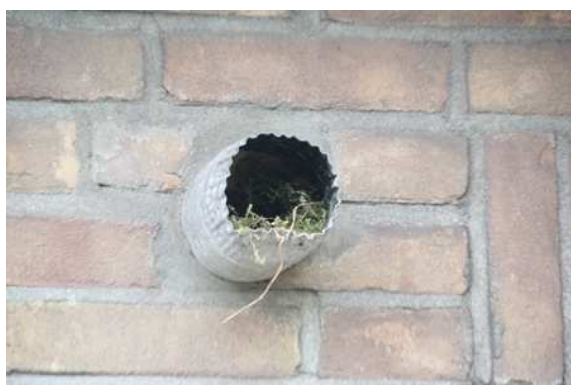
Vermoedelijke nestplaats van een winterkoning of koolmees in een rookafvoerkanaal in de zijgevel van de woning.

Er zijn geen directe aanwijzingen gevonden, maar het is aannemelijk dat er ieder voortplantingsseizoen vogels in het plangebied nestelen. Daarbij gaat het vermoedelijk om algemene- en weinig kritische soorten als merel, koolmees, vink, witte kwikstaart, houtduif, winterkoning, heggemus, Turkse tortel, zanglijster en tjiftjaf. Deze soorten kunnen nestelen in bomen, struiken en in dichte vegetatie op de grond. Soorten als koolmees, winterkoning en houtduif nestelen ook vaak in toegankelijke gebouwen, terwijl de witte kwikstaart uitsluitend in toegankelijke gebouwen nestelt. Er zijn in het plangebied geen huismussen vastgesteld.