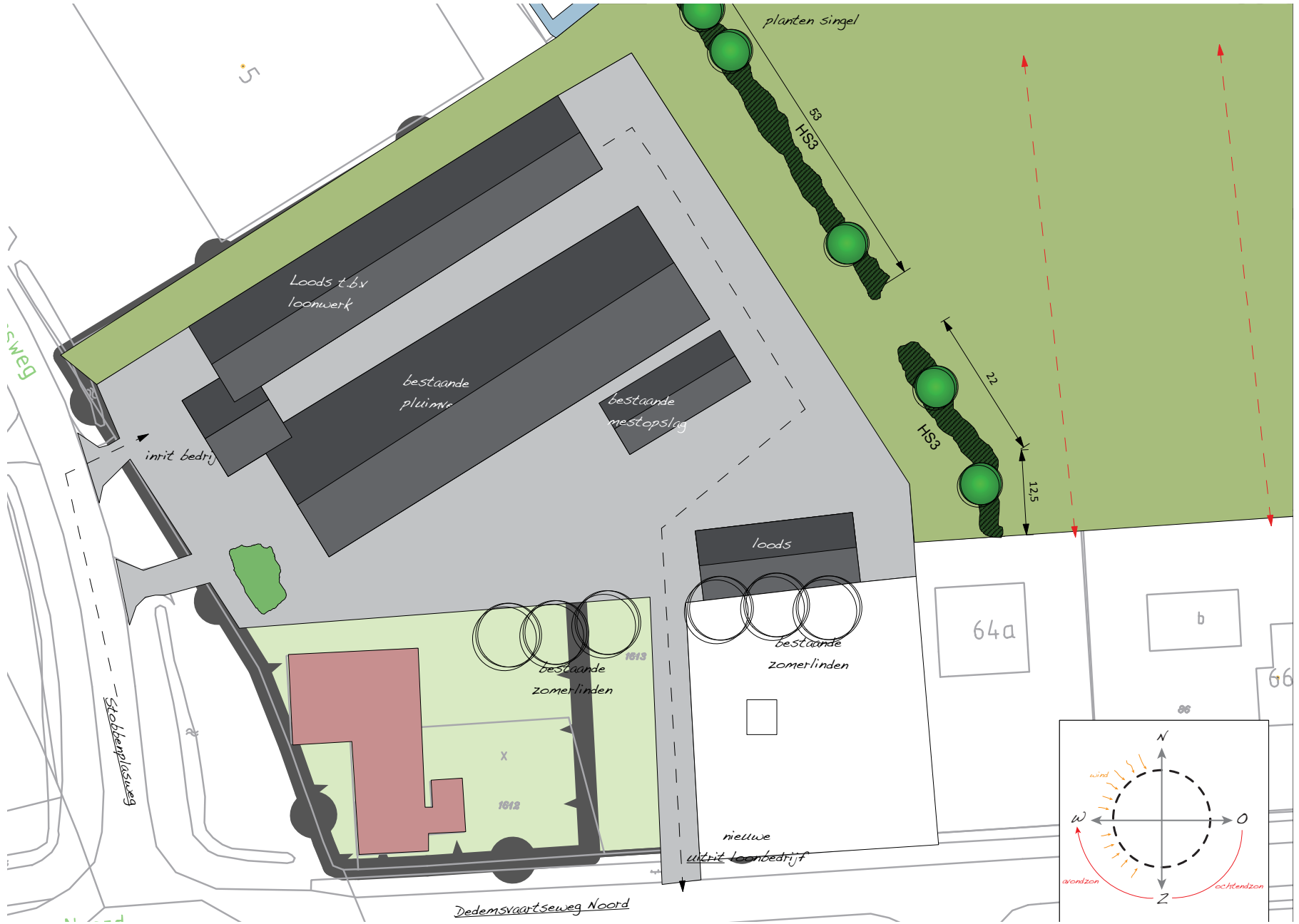
Erfinrichtingsplan Dedemsvaartseweg Noord en Stobbeplassweg