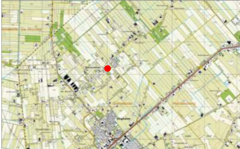
Globale ligging van het plangebied. De ligging van het plangebied wordt met de rode stip aangeduid (bron: topotijdreis.nl).

Het plangebied is een perceel tussen de woningnummers 45a en 45e aan de Schuineslootweg te Schuinesloot. Het ligt in de woonkern van Schuinesloot en grenst aan de zuidzijde aan agrarisch cultuurland. Op onderstaande afbeelding wordt de globale ligging van het plangebied weergegeven op een topografische kaart.