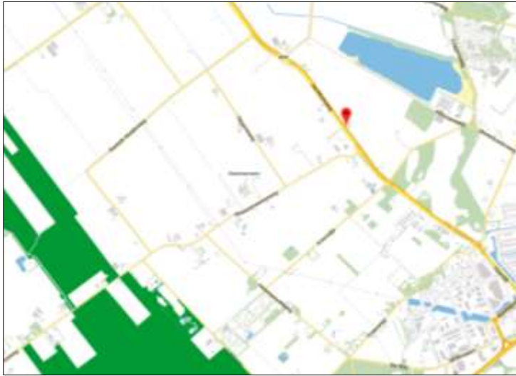
Ligging van het Natuurnetwerk Nederland in de omgeving van het plangebied. Het plangebied wordt met de rode marker aangeduid.