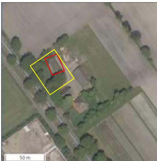
Begrenzing van het plangebied; deze wordt met de gele lijn aangeduid. Met de rode lijn wordt de te slopen kapschuur aangeduid.

Het plangebied vormt een deel van een agrarisch erf en bestaat uit bebouwing, grasland en enkele solitaire bomen. In het plangebied staat een kapschuur met bakstenen gevels, houten topgevels en golfplaten dakbedekking. In de kapschuur staan diverse agrarische werktuigen en ligt hooi opgeslagen. Het grasland rond de kapschuur bestaat uit een soortenarme vegetatie van raaigras. Het plangebied grenst aan de noordzijde agrarisch cultuurland, aan de westzijde aan openbare weg en aan de ander zijden aan erf. Op onderstaande luchtfoto is de begrenzing van het plangebied aangegeven. Voor een impressie van het plangebied wordt verwezen naar de fotobijlage.