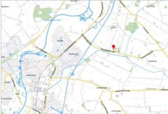
Globale ligging van het plangebied. De ligging van het plangebied wordt met de rode marker aangeduid.

Het plangebied is gesitueerd ten noordoosten van de woonkern gemeente Hardenberg en ligt in de buurtschap Loozen. Het is ten noorden van de Westeindigerdijk gelegen en ten oosten van kanaal Almelo De Haandrik. Het plangebied grenst aan bos, agrarisch landschap, een sloot en bebouwing. Op onderstaande afbeelding wordt de globale ligging van het plangebied weergegeven op een topografische kaart.