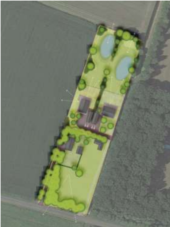
Verbeelding van het wenselijk eindbeeld.

Er zijn plannen om twee woningen met bijgebouw in het plangebied te bouwen. Om dit te realiseren dient de aanwezige verharding en puin verwijderd te worden. Het erf wordt nadien landschappelijk ingepast door middel van het aanplanten van bomen en een heg. Op onderstaande afbeelding wordt een plattegrond van het wenselijk eindbeeld weergegeven.