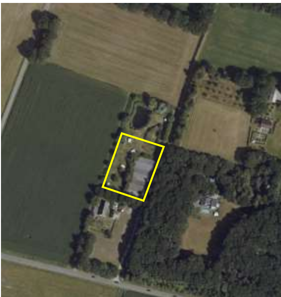
Begrenzing van het plangebied; deze wordt met de gele lijnen aangeduid.

Het plangebied vormt een agrarisch erf waar de agrarische bedrijfsvoering recent gestopt is en waar de bebouwing reeds geamoveerd is. Tijdens het uitgevoerde veldbezoek, bestond het plangebied uit erfverharding en betonvloer en een kleine berg puin, afval en twee voersilo's. Het plangebied grenst aan de zuidzijde aan een woonerf, aan de oostzijde aan bos, aan de noordzijde aan een landschapstuin en aan de westzijde aan agrarisch cultuurland. Op onderstaande luchtfoto is de begrenzing van het plangebied aangegeven. Voor een impressie van het plangebied wordt verwezen naar de fotobijlage.