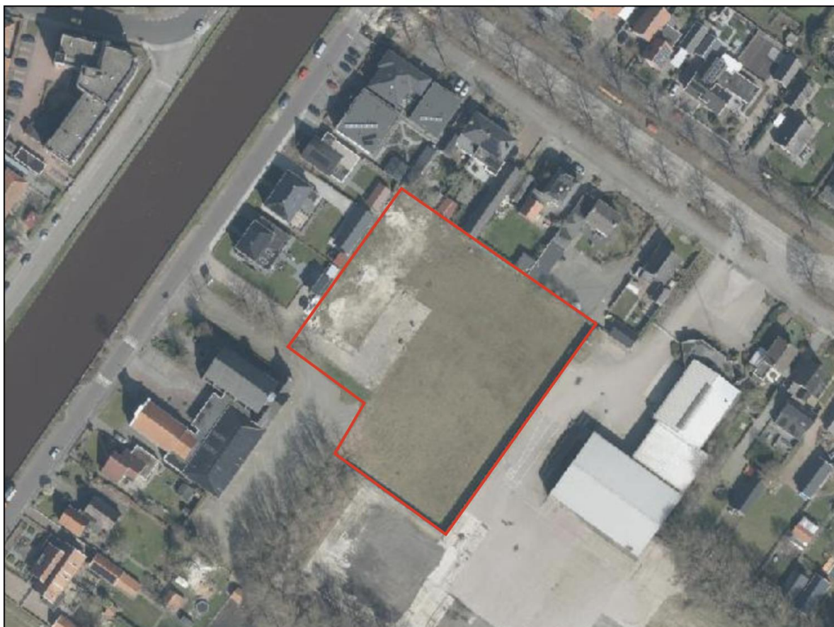
Afbeelding 3 Luchtfoto huidige situatie