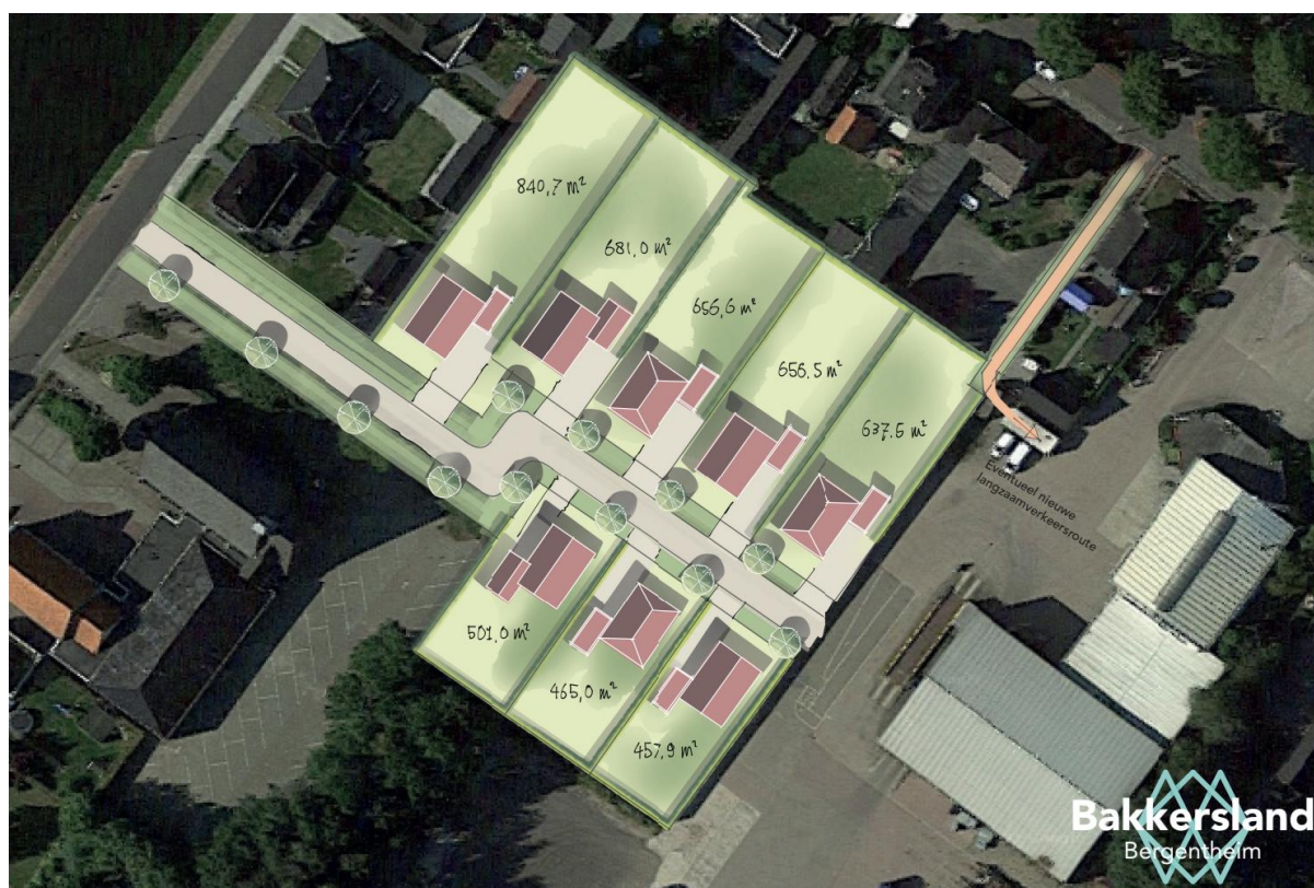
Afbeelding 2 Impressie gewenste invulling

Er zal in het projectgebied daarnaast ruimte worden gerealiseerd voor de benodigde infrastructuur, parkeer- en groenvoorzieningen. In de volgende afbeelding is een indicatief inrichtingstekening opgenomen. Opgemerkt wordt dat het bestemmingsplan biedt wat betreft inrichting, woningtypen en dergelijke.