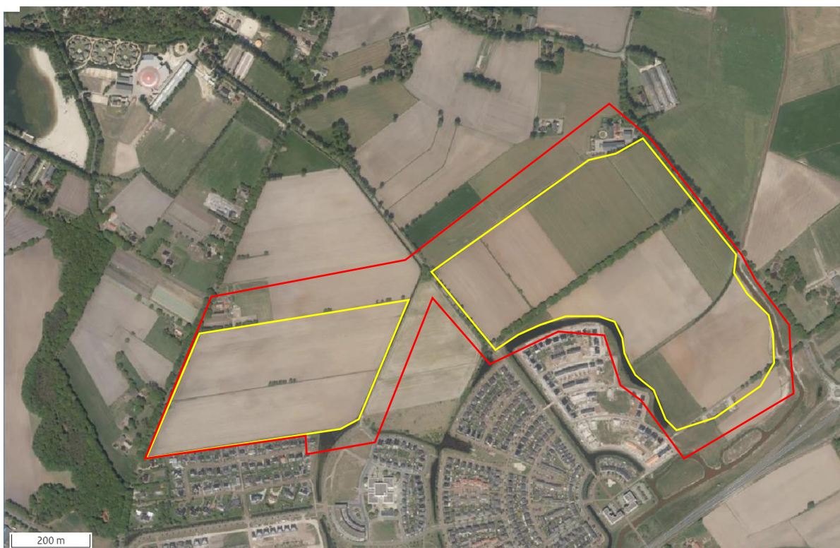
Begrenzing van het plangebied (gele lijn) en onderzoeksgebied (rode lijn).

Om de effecten van de voorgenomen activiteiten op dieren vast te kunnen stellen, wordt een groter gebied bekeken dan alleen het plangebied. Er zijn geen vaste normen voor het bepalen van de invloedssfeer. In deze studie wordt rekening gehouden met nestelende weide- en watervogels. Hiervoor wordt een verstoringafstand van 75-100 meter aangehouden, afhankelijk van de mate van openheid van het landschap. Het is niet aannemelijk dat beschermde waarden in, of achter laanbomen negatief beïnvloed worden. Aangenomen wordt dat geen verstoring optreedt in stedelijk gebied omdat beschermde dieren (hoofdzakelijk vogels) gewend zijn aan mensen en geluid. Verstoringafstanden in bos zijn gering vanwege de dekking door bladeren. Een verstoringafstand in verband met het verstoringgevaar van vaste rust- of voortplantingsplaatsen in hollen in de grond (das) is niet relevant vanwege het ontbreken van enig risico. Indien in het vervolg van deze studie gesproken wordt over plangebied, dan wordt onderstaand onderzoeksgebied bedoeld.