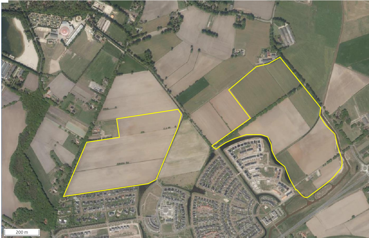
Begrenzing van het plangebied; deze wordt met de gele lijn aangeduid.