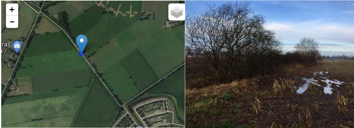
Foto links: waarneming van wezel net buiten het plangebied in 2017. Foto rechts: geschikt leefgebied voor de wezel net buiten het plangebied (Havermarsweg)