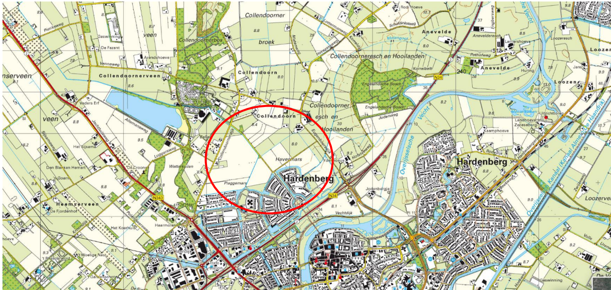
Globale ligging van het plangebied. De ligging van het plangebied wordt met de rode cirkel aangeduid.

Het plangebied is gesitueerd direct ten noordwesten van de huidige woonkern. Op onderstaande afbeelding wordt de globale ligging van het plangebied weergegeven op een topografische kaart.