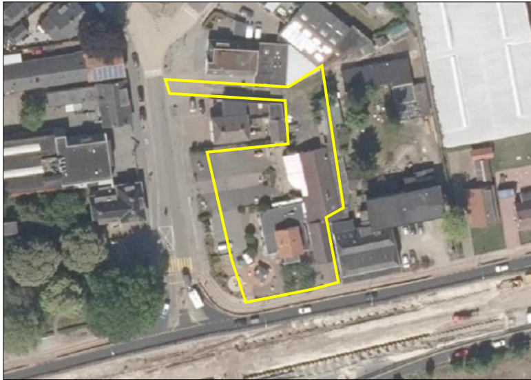
Begrenzing van het plangebied wordt met de gele lijn aangeduid.