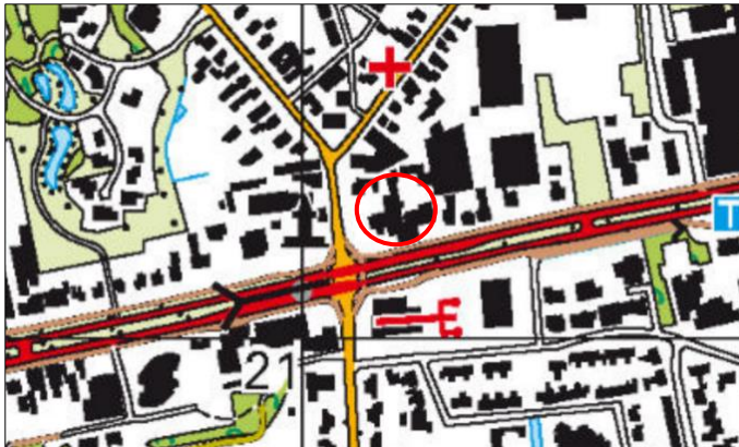
Globale ligging van het plangebied. De ligging van het plangebied wordt met de rode cirkel aangeduid.

Het plangebied is gesitueerd aan de Coevorderweg 2-4 Balkbrug, gemeente Hardenberg. Het ligt centraal gelegen in de woonkern Balkbrug en wordt omgeven door stedelijk gebied. Op onderstaande afbeelding wordt de globale ligging van het plangebied weergegeven op een topografische kaart.