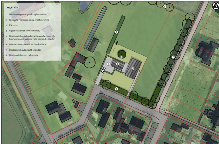
Verbeelding van het wenselijk eindbeeld.

Er zijn plannen een nieuwe woning met schuur in het plangebied te realiseren. Het nieuwe erf wordt via een erftoegangspad verbonden met de Meester Engbrinksweg. Om deze verbinding mogelijk te maken, dienen (mogelijk) enkele bomen en struweel gekapt te worden. Er wordt één solitaire loofboom aangeplant in het plangebied. Op onderstaande afbeelding wordt een plattegrond van het wenselijk eindbeeld weergegeven.