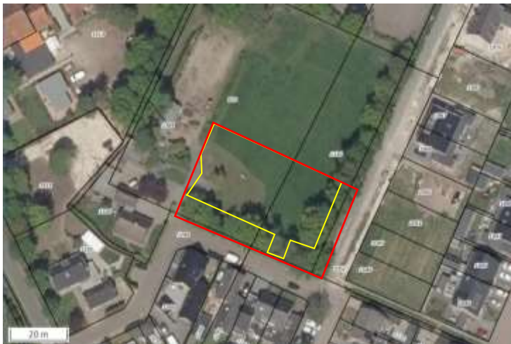
Begrenzing van het plangebied (gele lijn) en onderzoeksgebied (rode lijn).

De bouwwerkzaamheden worden uitgevoerd nabij opgaande beplanting. Om de effecten van voorgenomen activiteiten volledig in beeld te kunnen brengen, wordt de houtsingel ten oosten en zuiden meegenomen in het onderzoek. Indien in het vervolg van dit rapport gesproken wordt over 'plangebied', wordt onderstaand onderzoeksgebied bedoeld. Op onderstaande afbeelding wordt het onderzoeksgebied weergegeven.