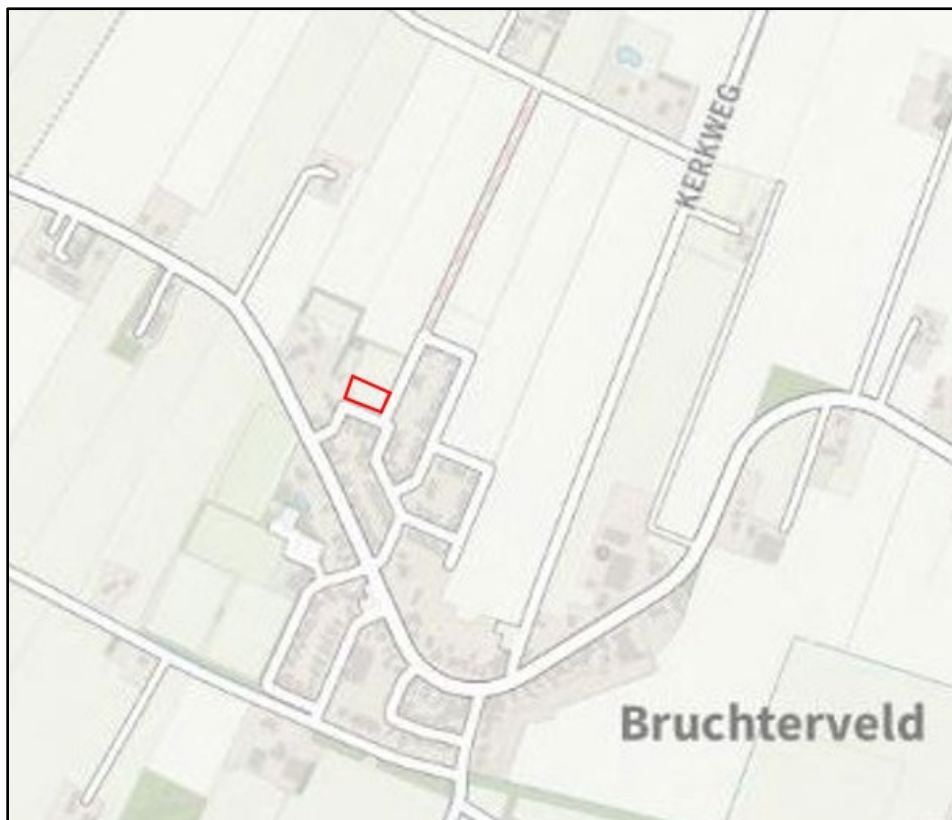
Afbeelding 1.1 Ligging projectgebied

In afbeelding 1.1 is de ligging van het projectgebied indicatief met rode omlijning weergegeven.