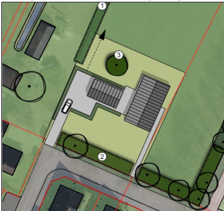
Afbeelding 3.1 Inrichtingsplan projectgebied

Initiatiefnemer is voornemens op het onbebouwde perceel tegenover de Meester van Engbrinkstraat nr. 17 een woning te realiseren. In onderstaande afbeelding 3.1 is de gewenste situatie weergegeven.