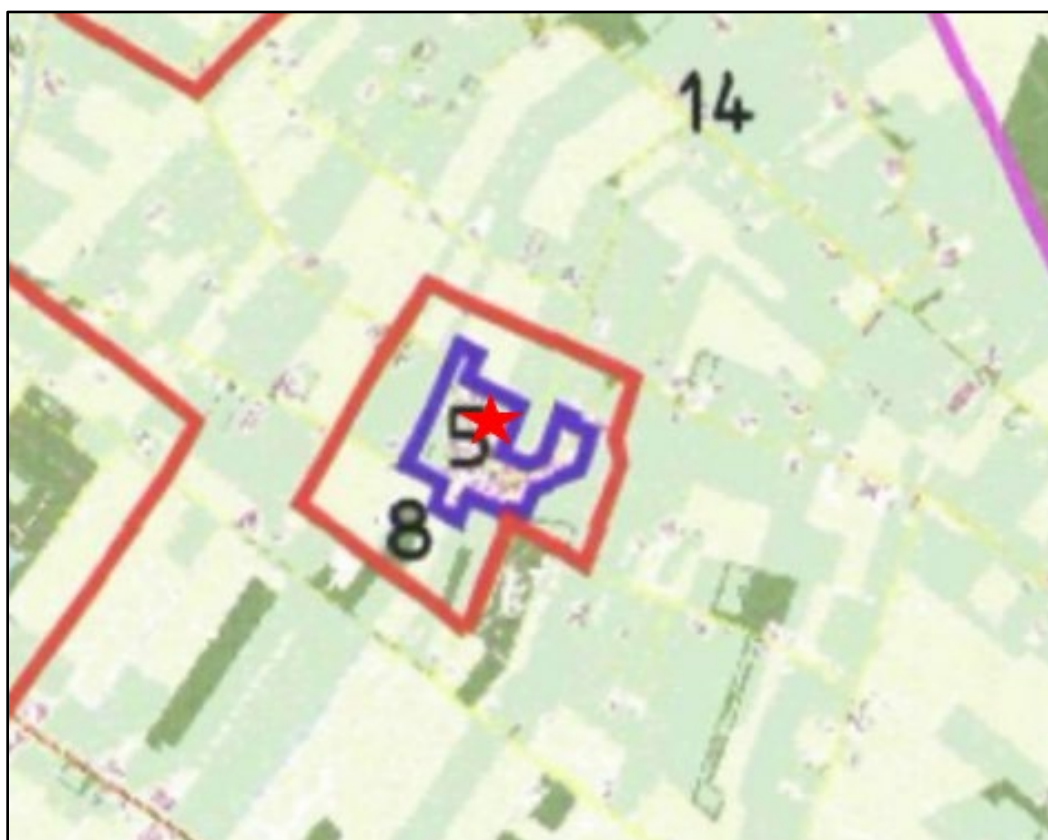
Afbeelding 2.1 Ligging projectgebied maximaal aantal odeureenheden (bron: Verordening geurhinder en veehouderij gemeente Hardenberg)

Onderstaand kaartbeeld omvat een uitsnede van de bij deze geurverordening behorende kaart. Voor de locatie aan de Meester van Engbrinkstraat in Bruchterveld geldt een geurnorm van 5 odeureenheden. In afwijking van het bepaalde in artikel 4 lid 1 van de Wet bedraagt de minimale afstand van een bestaande veehouderij tot een geurgevoelig object in de gemeente Hardenberg: Binnen bebouwde kom 50 meter en buiten bebouwde kom 25 meter.