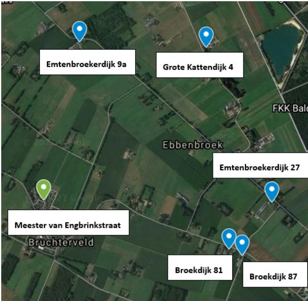
Afbeelding 3.2 Ligging veehouderijen ten opzichte van de te realiseren woning

Om de voorgrondgeurbelasting op de te realiseren woning te berekenen wordt de maatgevende veehouderij aan de Emtenbroekerdijk 9a in de berekening aangehouden, aangezien deze veehouderij het dichtstbij de te realiseren woning ligt en een aanzienlijke geuruitstoot heeft.