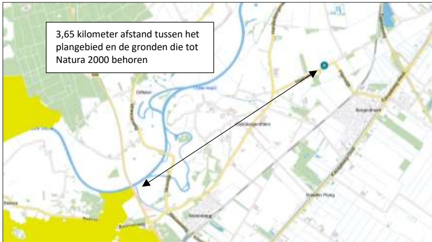
Ligging van Natura 2000-gebied in de omgeving van het plangebied. De ligging van het plangebied wordt met de blauwe marker aangeduid. Gronden die tot Natura 2000 behoren worden met de okergele kleur aangeduid (bron: pdok.nl).