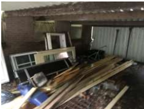
Amfibieën kunnen een (winter)rustplaats bezetten onder spullen/rommel.

Tijdens het veldbezoek zijn geen amfibieën waargenomen, maar gelet op de inrichting en het gevoerde beheer, wordt het plangebied als functioneel leefgebied voor sommige algemene en weinig kritische amfibieënsoorten beschouwd. Amfibieën als bruine kikker en gewone pad benutten het plangebied als foerageergebied en mogelijk bezetten ze er een (winter)rustplaats. Deze soorten kunnen een (winter)rustplaats bezetten onder opgeslagen spullen/rommel, strooisel en bladeren en in holen en gaten in grond. Een deel van de opgeslagen spullen/rommel staan in de gebouwen die toegankelijk zijn voor amfibieën om te betreden. Het plangebied wordt niet als functioneel leefgebied van zeldzame amfibieënsoorten als kamsalamander, rugstreeppad of poelkikker beschouwd. Geschikt voortplantingsbiotoop ontbreekt in het plangebied.