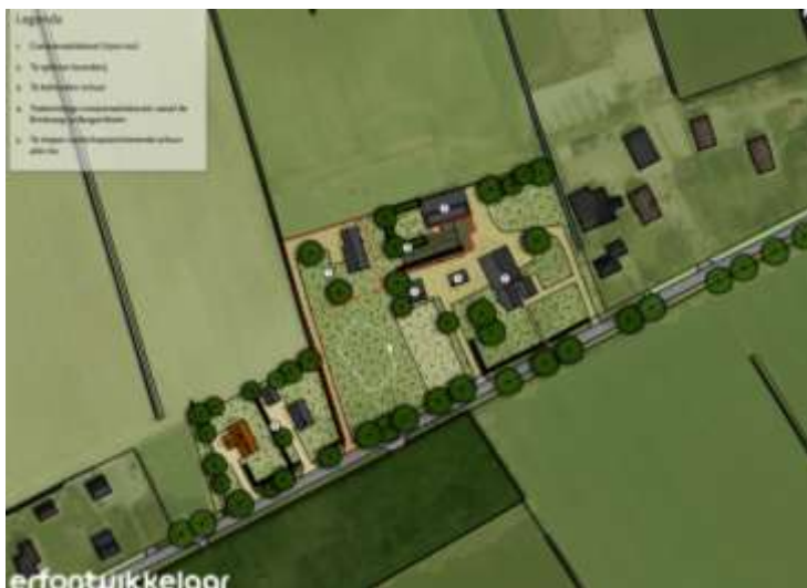
Verbeelding van het wenselijk eindbeeld.

Er zijn plannen om aanwezige schuur te slopen en drie woningen te realiseren ten westen van het erf. Deze drie woningen worden gebouwd in agrarisch cultuurland. De aanwezige kavelgrensbeplanting wordt niet verwijderd. De nieuwe woonerven worden landschappelijk ingepast d.m.v. de aanplant van erfbeplanting. Op onderstaande afbeelding wordt een plattegrond van het wenselijk eindbeeld weergegeven.