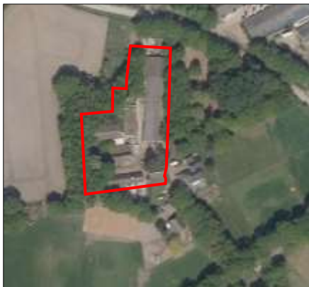
Begrenzing van het onderzoeksgebied; deze wordt met de rode lijnen aangeduid.

Om het effect van de voorgenomen activiteiten volledig in beeld te kunnen brengen, is een strook van 10 meter ten westen van het plangebied (Brinkweg 2a) meegenomen in het onderzoek. Indien in dit rapport gesproken wordt over plangebied wordt onderstaand onderzoeksgebied bedoeld.