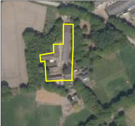
Begrenzing van het plangebied; deze wordt met de gele lijnen aangeduid.

Het plangebied vormt een deel van een agrarisch woonerf, waar de agrarische activiteiten enige tijd geleden gestaakt zijn. Het bestaat volledig uit bebouwing en erfverharding. In het plangebied staan een oude boerderij met aangebouwde schuur en vier stallen. De stallen beschikken over bakstenen buitengevels en zijn gedekt met golfplaten. De boerderij heeft een rieten kap waarover golfplaten zijn gemonteerd. De staat van onderhoud van de gebouwen is slecht. Van verschillende schuren en de oude boerderij is het dak (deels) ingestort waardoor deze gebouwen niet meer wind- of waterdicht zijn. Ook hebben sommige gebouwen gaten in zijgevels. Alle gebouwen stonden al geruime tijd leeg tijdens het veldbezoek. Ten noorden van het plangebied ligt de Brinkweg. Op onderstaande luchtfoto is de begrenzing van het plangebied aangegeven. Voor een impressie van het plangebied wordt verwezen naar de fotobijlage.