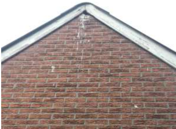
Schijtsporen van spreeuw voor de ingang van de nestholte.

Het plangebied behoort tot functioneel leefgebied van verschillende vogelsoorten. Vogels benutten het plangebied als foerageergebied en vermoedelijk nestelen er jaarlijks vogels in het plangebied. Vogels kunnen nestelen in de beplanting en toegankelijke bebouwing. Een deel van de bebouwing beschikt over invliegopeningen en is daardoor toegankelijk voor vogels om in te gaan nestelen. Vogelsoorten die mogelijk in het plangebied nestelen zijn spreeuw, merel, houtduif, holenduif, boomkruiper en winterkoning. In het plangebied zijn oude nesten van boerenzwaluwen of huiszwaluwen waargenomen. Tevens zijn geen aanwijzingen gevonden dat steen- of kerkuil er een vaste rust- of nestplaats bezetten. Aanwezigheid van deze soorten in gebouwen is doorgaans gemakkelijk vast te stellen aan de hand van braakballen, schijtsporen en ruiveren. Er zijn op het erf geen huismussen waargenomen en de bebouwing wordt niet beschouwd als potentiële nestplaats voor huismussen.