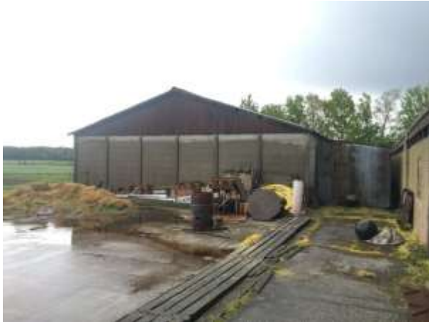
Amfibieën kunnen een (winter)rustplaats bezetten onder spullen/rommel.

Door het verwijderen van opgeslagen spullen/rommel wordt mogelijk een amfibie gedood en wordt mogelijk een vaste (winter)rustplaats beschadigd en/of vernield. Als gevolg van de voorgenomen activiteiten neemt de geschiktheid van het plangebied als foerageergebied van amfibieën niet af.