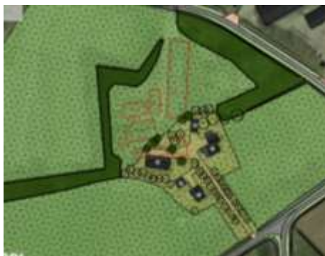
Verbeelding van het wenselijk eindbeeld.

Er zijn plannen om alle opstallen in het plangebied te slopen en een nieuwe schuur in het plangebied te bouwen. Tevens wordt aangenomen dat een deel van de bestaande erfverharding wordt verwijderd. Op onderstaande afbeelding wordt een plattegrond van het wenselijk eindbeeld weergegeven.