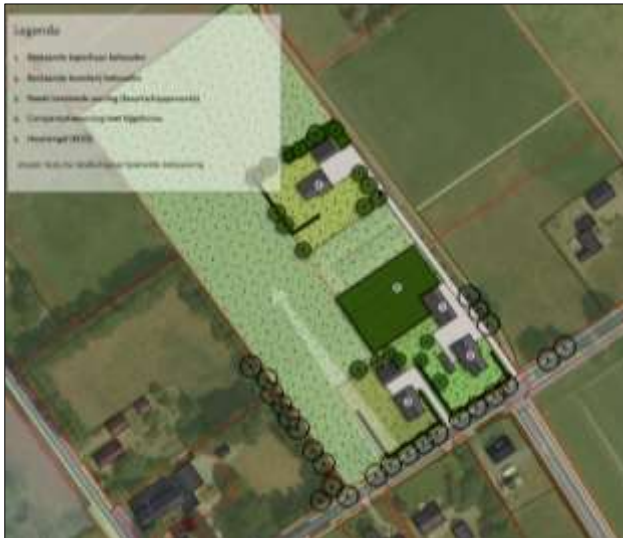
Verbeelding van het wenselijk eindbeeld.

Er zijn plannen om de drie stallen te slopen en een nieuw woonerf te realiseren. Op dit woonerf wordt een woning met bijgebouw gerealiseerd. Deze nieuwe woning met bijgebouw worden gerealiseerd in het noordelijke deel van het plangebied op het agrarisch cultuurland. De woning en het bijgebouw worden d.m.v. een nieuw aan te leggen (verharde) inrit in verbinding gebracht met het zuidelijk gelegen woonerf en de Rheezeveenseweg. Het nieuwe erf wordt nadien landschappelijk ingepast door middel van de aanplant van erfbeplanting. Op onderstaande afbeelding wordt een plattegrond van het wenselijk eindbeeld weergegeven.