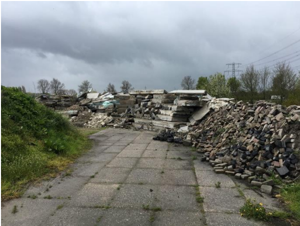
Amfibieën kunnen een (winter)rustplaats bezetten onder afval, rommel en puin..

Tijdens het veldbezoek zijn geen amfibieën waargenomen, maar gelet op de inrichting en het gevoerde beheer, wordt het plangebied als functioneel leefgebied voor sommige algemene en weinig kritische amfibieënsoorten beschouwd. Amfibieën als bruine kikker, gewone pad benutten het plangebied als foerageergebied en mogelijk bezetten ze er een (winter)rustplaats. Deze soorten kunnen een (winter)rustplaats bezetten in holen en gaten in de grond en onder strooisel, bladeren, opgeslagen spullen, rommel en puin, zowel in gebouwen als in de buitenruimte. Het plangebied wordt niet als functioneel leefgebied van zeldzame amfibieënsoorten als kamsalamander, rugstreepad of poelkikker beschouwd. Geschikt voortplantingsbiotoop ontbreekt in het plangebied.