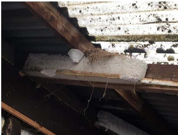
Oud merelnest in één van de te slopen gebouwen.

Het plangebied behoort tot functioneel leefgebied van verschillende vogelsoorten. Vogels benutten het plangebied als foerageergebied en vermoedelijk nestelen er jaarlijks vogels in het plangebied. Vogels kunnen een nestlocatie bezetten in de toegankelijke bebouwing, beplanting. Vogelsoorten die mogelijk in het plangebied nestelen zijn merel, houtduif, winterkoning, vink, en tjiftjaf. In het plangebied zijn geen aanwijzingen gevonden dat huismussen, huiszwaluwen of boerenzwaluwen er een nestplaats bezetten. Voorgenoemde soorten zijn niet waargenomen in het plangebied en er zijn geen oude of bezette nesten van deze soorten aangetroffen. Tevens zijn geen aanwijzingen gevonden dat steen- of kerkuil er een vaste rust- of nestplaats bezetten. Aanwezigheid van deze soorten in gebouwen is doorgaans gemakkelijk vast te stellen aan de hand van braakballen, ruiveren en schijtsporen. Er zijn ook geen aanwijzingen dat roofvogels een vaste rust- of nestplaats in het plangebied bezetten.