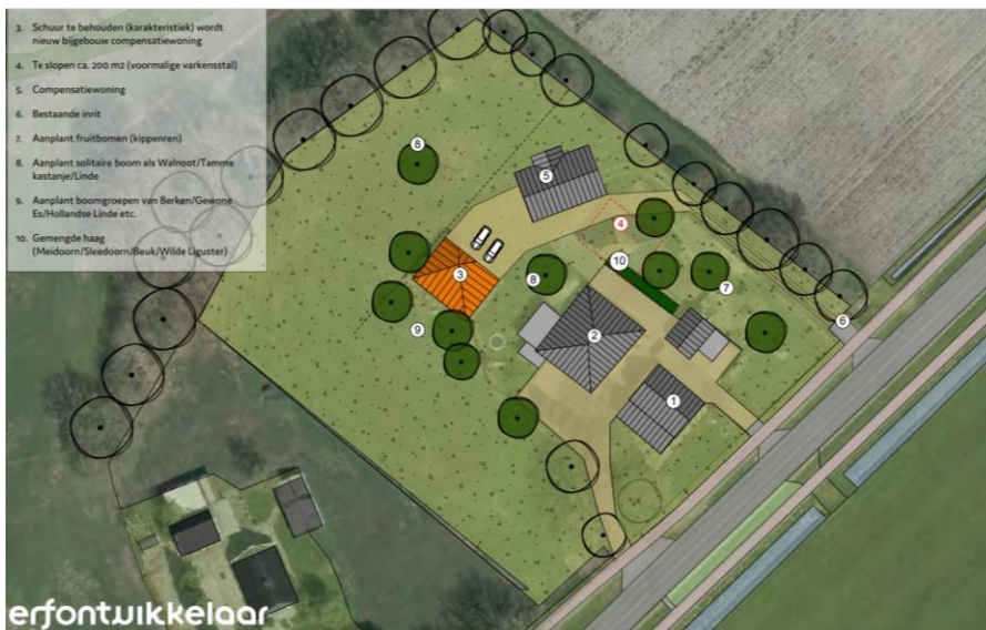
Verbeelding van het wenselijke eindbeeld van deelgebied Hardenbergerweg.

Het voornemen bestaat de schuur aan de oostzijde in deelgebied Hardenbergerweg te slopen, evenals alle bebouwing in de beide andere deelgebieden. In deelgebied Hardenbergerweg wordt vervolgens een vrijstaande woning gebouwd. De schuur net ten westen van het plangebied Hardenbergerweg wordt gebruikt als bijgebouw bij de nieuw te bouwen woning. De ondergrond van alle te slopen bebouwing wordt ingericht als erf/tuin/ de nieuwe woning in deelgebied Hardenbergerweg, krijgt een nieuwe erftoegangspad naar de Hardenbergerweg. Het erf in deelgebied Hardenbergerweg wordt landschappelijk ingepast middels de aanplant van erfbeplanting. Op onderstaande afbeelding wordt een verbeelding van het wenselijke eindbeeld in deelgebied Hardenbergerweg weergegeven.