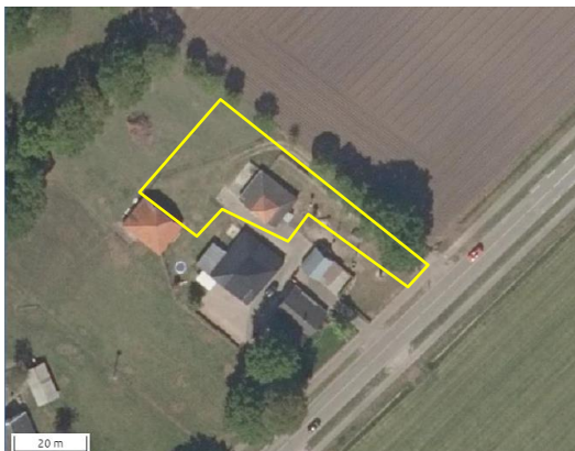
Begrenzing van deelgebied Hardenbergerweg; deze wordt met de gele lijn aangeduid.

Dit deelgebied vormt een deel van een woonerf en bestaat uit grasland, erfverharding en bebouwing. In het plangebied staat een schuur met bakstenen buitengevels en een dakbedekking bestaande uit dakpannen (deels) en golfplaten (deels). De schuur beschikt niet over een geïsoleerde of beschoten kap en wordt gebruikt als opslagplaats. Het grasland bestaat uit een soortenarme vegetatie en wordt als gazon beheerd. Het plangebied grenst aan de zuidzijde aan een woonerf, aan de noordzijde aan grasland (ponyweide) en aan de oostzijde aan agrarisch cultuurland. Op onderstaande afbeelding wordt de begrenzing van deelgebied Hardenbergerweg op een luchtfoto weergegeven. Voor een impressie van het plangebied wordt verwezen naar de fotobijlage.