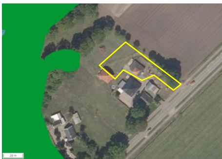
Ligging van Natuurnetwerk Nederland in de omgeving van het plangebied. De ligging van het plangebied wordt met de rode marker aangeduid. Gronden die tot Natuurnetwerk Nederland behoren worden met de groene kleur op de kaart aangeduid (bron: ruimtelijkeplannen.nl).

Omdat op de slooplocaties sprake is van het slopen van bestaande bebouwing op een woonerf, wordt aangenomen dat dit niet strijdig is met provinciaal beleid t.a.v. het Natuurnetwerk Nederland. In deelgebied Hardenbergerweg wordt een woning toegevoegd aan een bestaand erf. Dit deelgebied ligt buiten de begrenzing van het Natuurnetwerk Nederland. Op onderstaande afbeelding wordt de ligging van het Natuurnetwerk Nederland in de omgeving deelgebied Hardenbergerweg weergegeven.