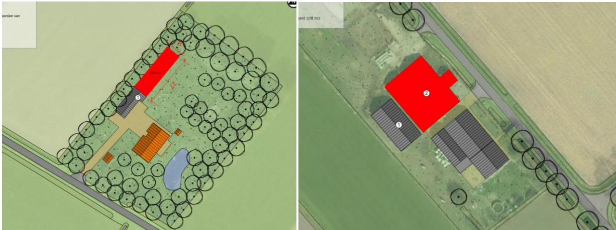
Afbeelding links: aanduiding van de te slopen bebouwing in deelgebied Veldingerweg. Afbeelding rechts: aanduiding van de te slopen bebouwing in deelgebied Kosseweg. De te slopen bebouwing wordt met het rode vlak aangeduid.

Beide deelgebieden vormen een deel van een woonerf en bestaan volledig uit bebouwing. Deelgebied Veldingerveldweg vormt een deel van een bestaande schuur. Deze schuur heeft een bakstenen borstwering en houten zijgevels en is gedekt met golfplaten. De schuur is voorzien van dakisolatie en staat geruime tijd leeg. De bebouwing in deelgebied Kosseweg bestaat uit drie, aan elkaar gebouwde schuren. De schuren hebben deels bakstenen zijgevels en deels zijgevels van damwand en zijn gedekt met golfplaten. De schuren in deelgebied Kosseweg waren leeg en bezemschoon. Op onderstaande luchtfoto's worden de onderzochte opstallen in de beide deelgebieden weergegeven.