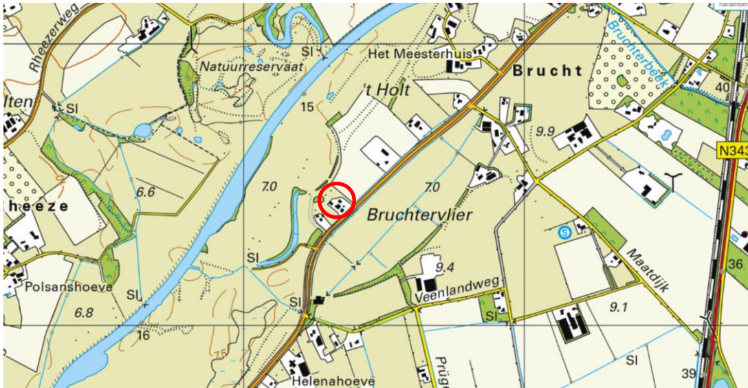
Globale ligging van het plangebied. De ligging van het plangebied wordt met de rode marker aangeduid.

Het plangebied bestaat uit drie deelgebieden; één sloop- en bouwlocatie en twee slooplocaties. Te weten Hardenbergerweg 16 te Brucht (sloop en bouw), Veldingerveldweg 26 te Radewijk en Kosseweg 8 te Schuinesloot (beide sloop schuur). Alle drie deelgebieden liggen in het buitengebied. De bouwlocatie aan de Hardenbergerweg ligt circa 1,4 kilometer ten zuiden van de woonkern Hardenberg. Op onderstaande afbeelding wordt de globale ligging van het plangebied weergegeven op een topografische kaart.