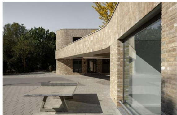
figuur 4, alzijdige oriëntatie