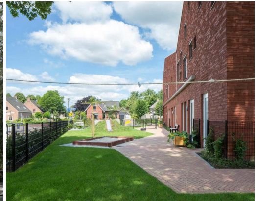
figuur 5, schoolgevels gericht op buitenruimtes