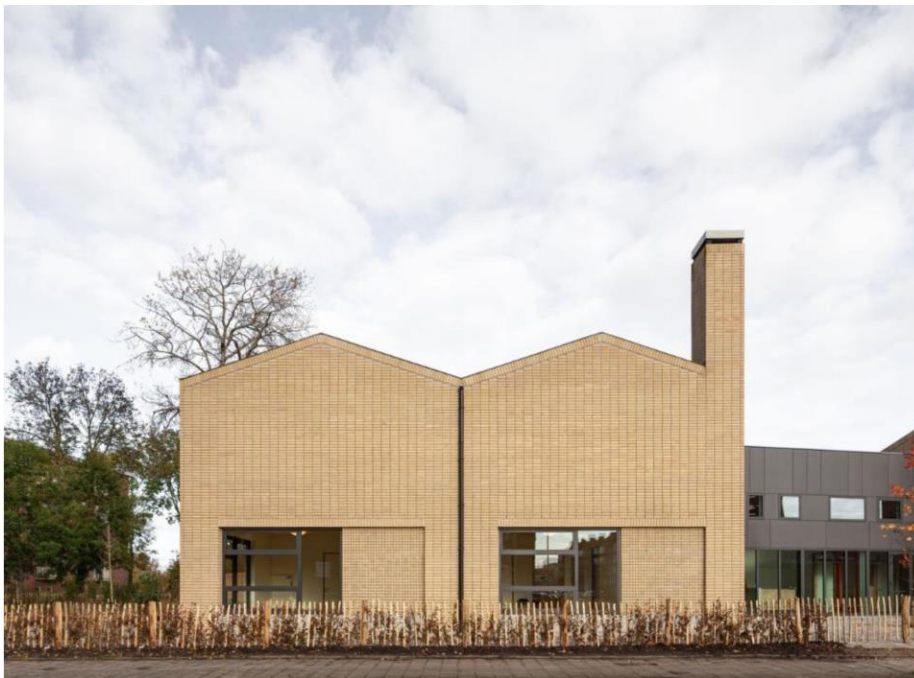
figuur 3, herkenbare, heldere hoofdvorm