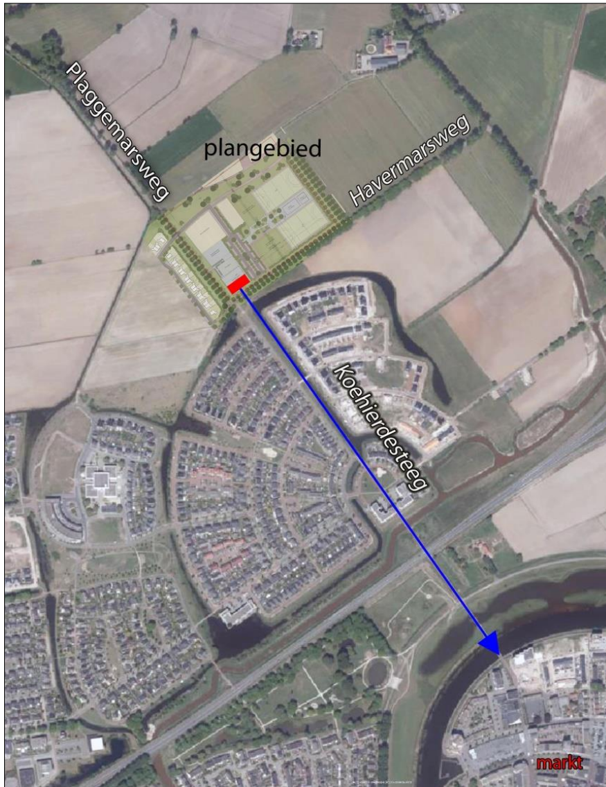
Figuur 1. Lange open zichtlijn vanaf de school tot het stadscentrum