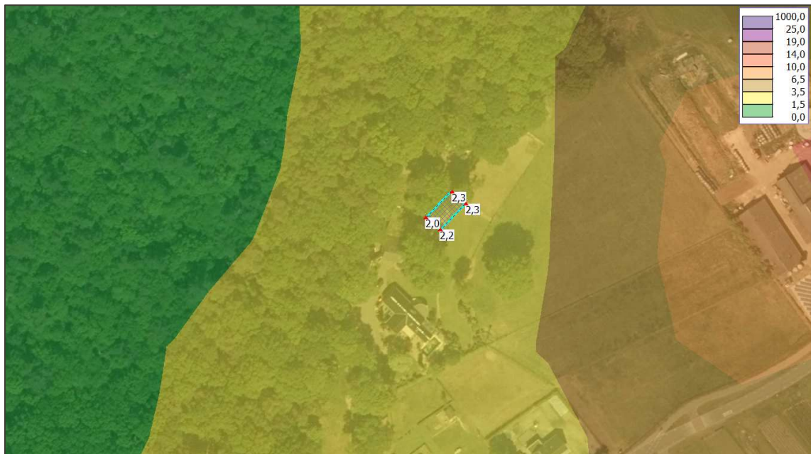
Afbeelding 5 Berekende achtergrondgeurbelasting ter plaatse van de RvR-woning [ \text{OU}_E/\text{m}^3 ]

Uit voorgaande afbeelding blijkt dat de achtergrondgeurbelasting ter plaatse van de woning binnen het plan tussen de 1,5 en 3,5 \text{OU}_E/\text{m}^3 bedraagt. In navolgende afbeelding is de berekende achtergrondgeurbelasting ter plaatse van de woning binnen het plangebied weergegeven.