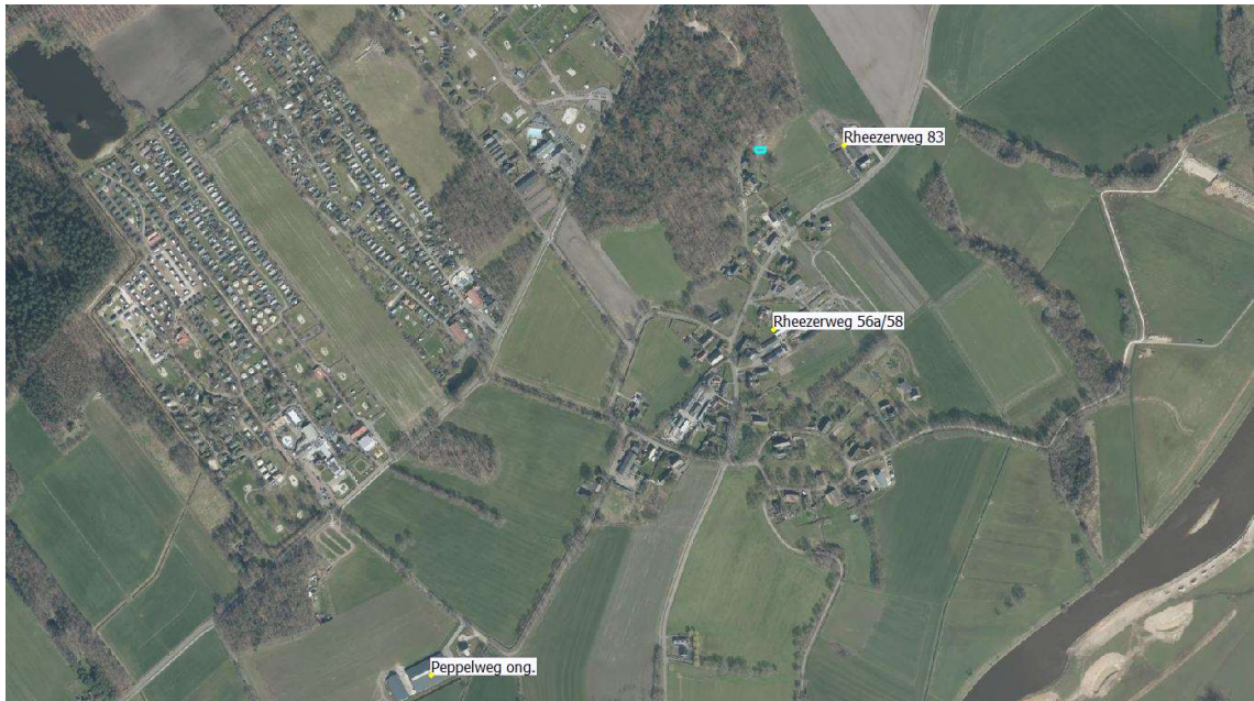
Afbeelding 3 Situering RvR-woning (blauwe kader) en omliggende veehouderijen