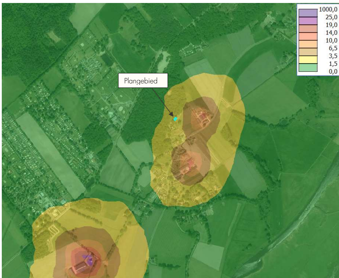
Afbeelding 4 Geurcontouren achtergrondgeurbelasting (plangebied blauwe kader)

In navolgende afbeelding zijn de geurcontouren van de achtergrondgeurbelasting rondom het plangebied weergegeven.