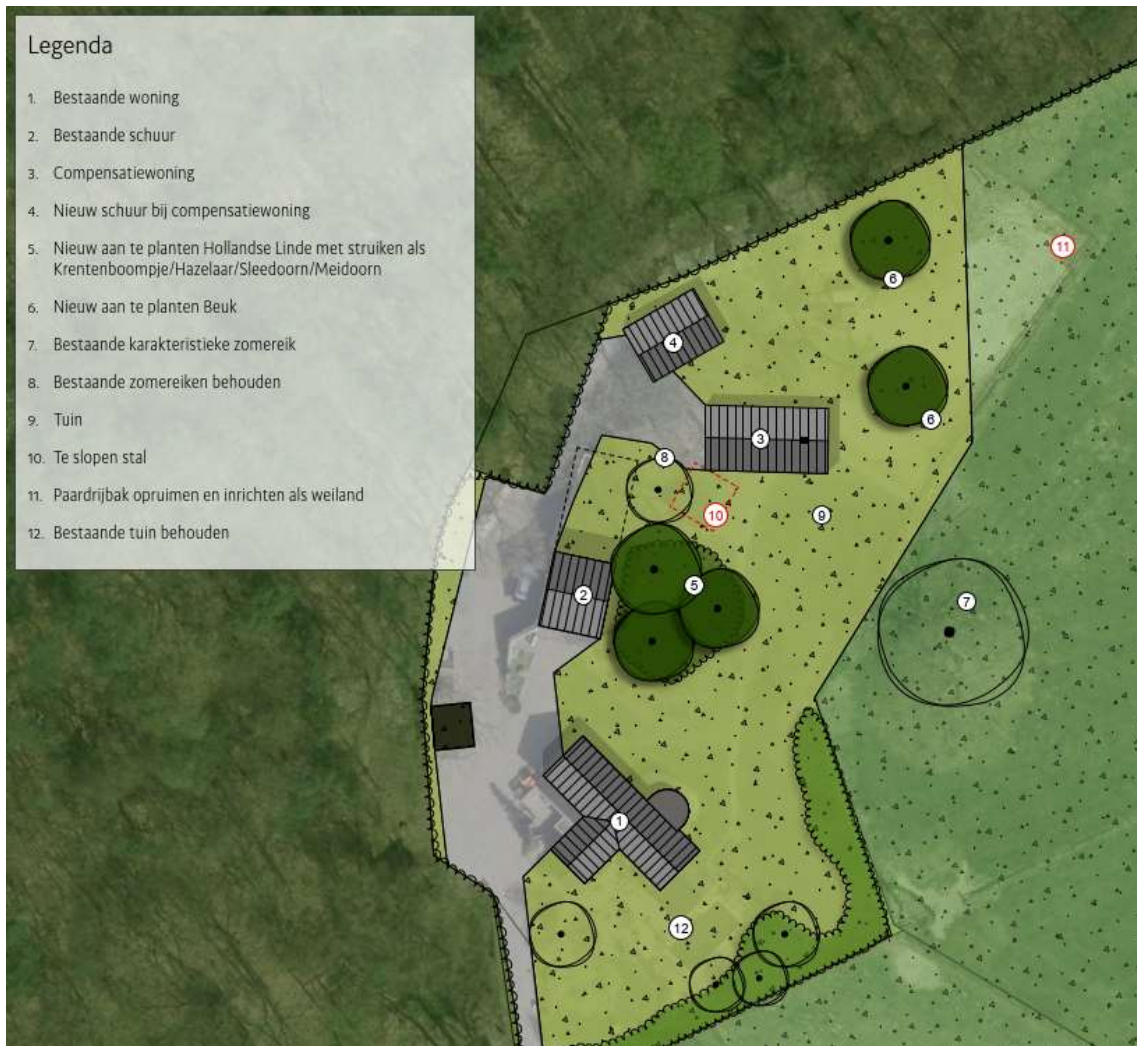
Afbeelding 2 Indeling plangebied (situering RvR-woning nummer 3)