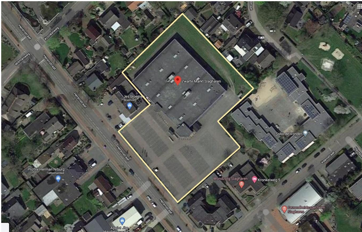
Figuur 4: Exacte ligging en begrenzing van de onderzochte locatie.

Ten behoeve van deze plannen zullen geen bomen worden gekapt geen sloten, vijvers of andere watergangen gedempt. Voor een impressie van de nieuwe situatie: zie bijlage 2. Pagina 26.