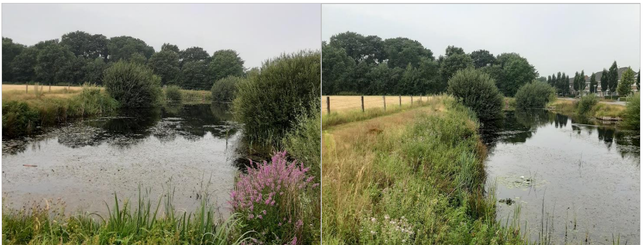
Figuur 3-3. Impressie de noordzijde van het plangebied met links een foto van de watergang tussen de bebouwing in de richting van het plangebied en rechts een foto van dezelfde watergang in westelijke richting.