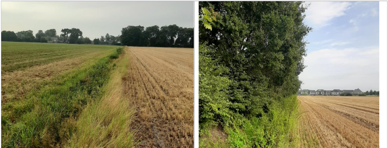
Figuur 3-4. Foto links een impressie op de oostelijke grens van het plangebied en met rechts een foto van de bosschage aan de westkant van het plangebied in noordelijke richting (foto's: RHDHV).