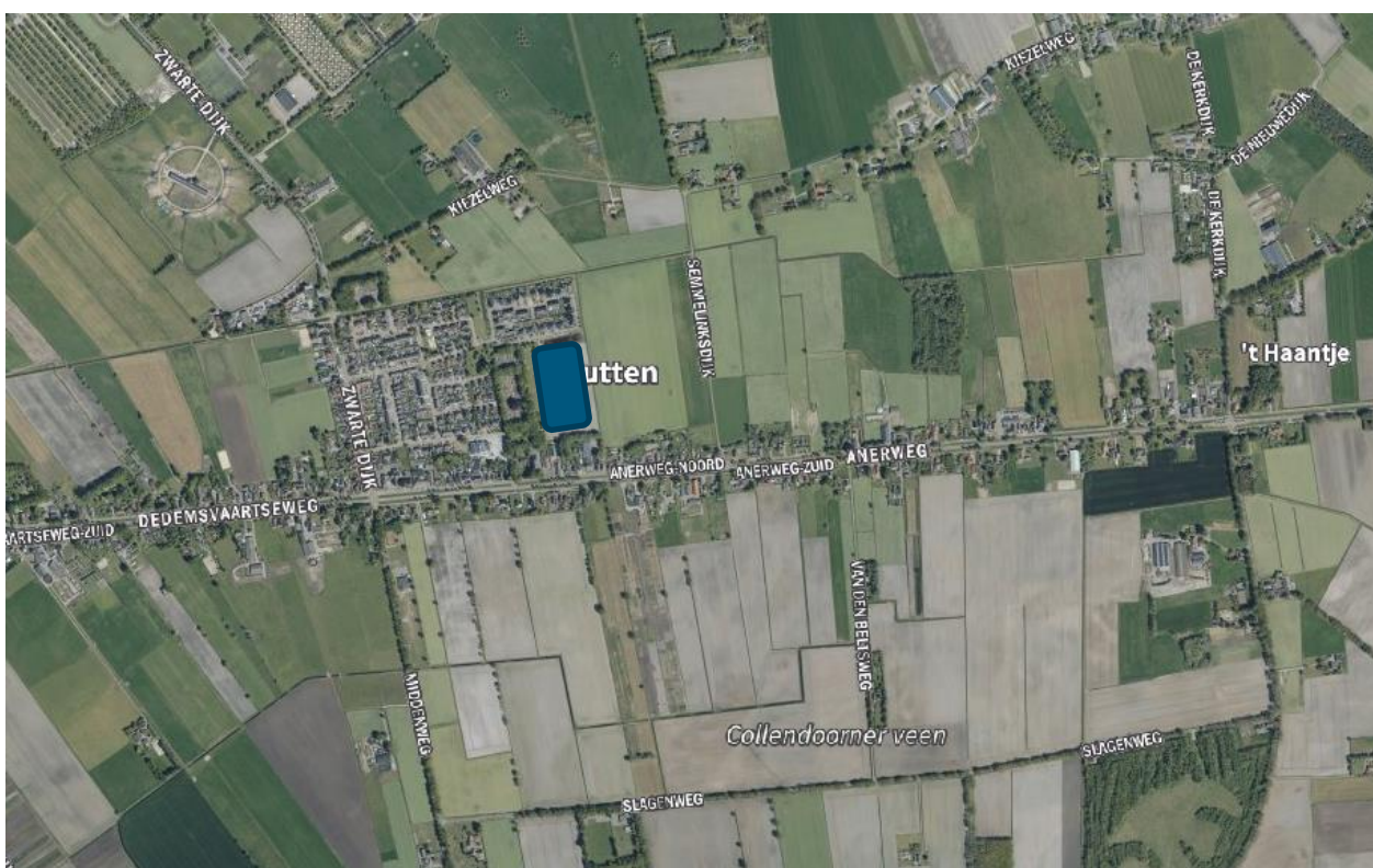
Figuur 3-1. Luchtfoto met de globale ligging van het plangebied (het blauwe vlak; bron: Cyclomedia).

Het plangebied is gelegen aan de oostkant van Lutten, aan de Ahornstraat (zie Figuur 3-1 en Figuur 3-2). Het plangebied bestaat uit braakliggende landbouwgrond, waarop dit jaar graan is verbouwd (zie Figuur 3-3). Aan de noord- en zuidzijde grenst het plangebied aan bebouwing, aan de noordzijde wordt het plangebied van de bebouwing gescheiden door circa tien meter brede watergang. Aan de westkant grenst het plangebied aan een bosschage met daartussen een ondiepe droogliggende watergang en aan de oostzijde grenst het plangebied aan akkergronden, wederom gescheiden door een ondiepe droogliggende watergang. In de omgeving van het plangebied bevinden zich voornamelijk landbouwgronden.