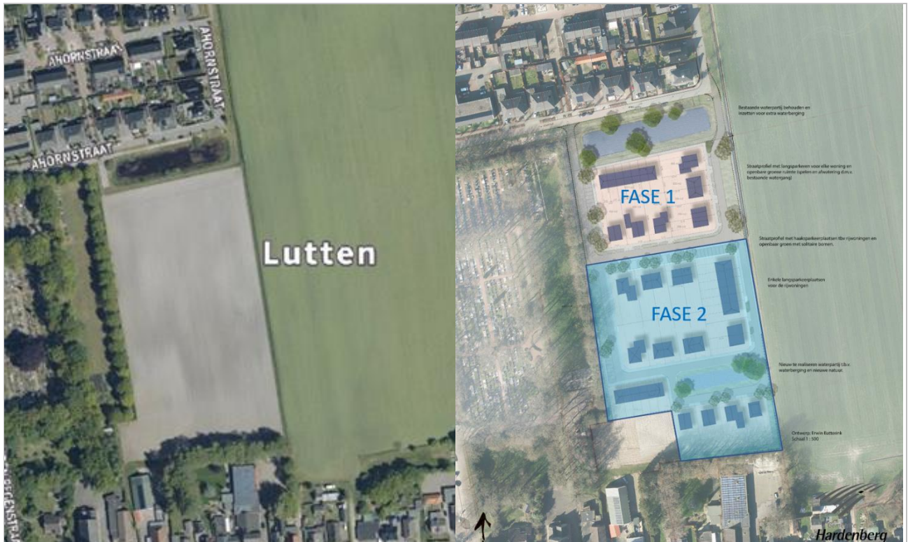
Figuur 3-2. Links een luchtfoto ingezoomd op het plangebied, gelegen aan de Ahornstraat (bron: Cyclomedia) en rechts een schetsontwerp van de voorgenomen eindsituatie (bron: Gemeente Hardenberg).