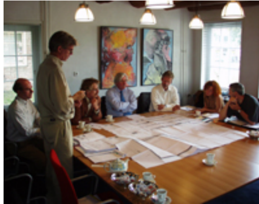
Figuur 3 toetsingskaders