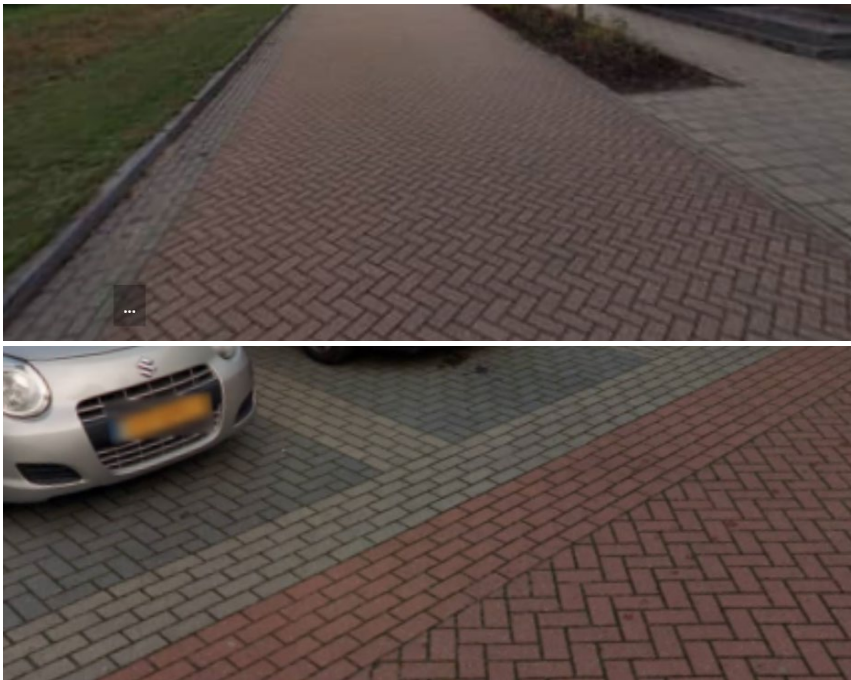
Figuur 10 materialisering openbare ruimte (rijbaan en parkeerplek) aansluitend bij eerste fase