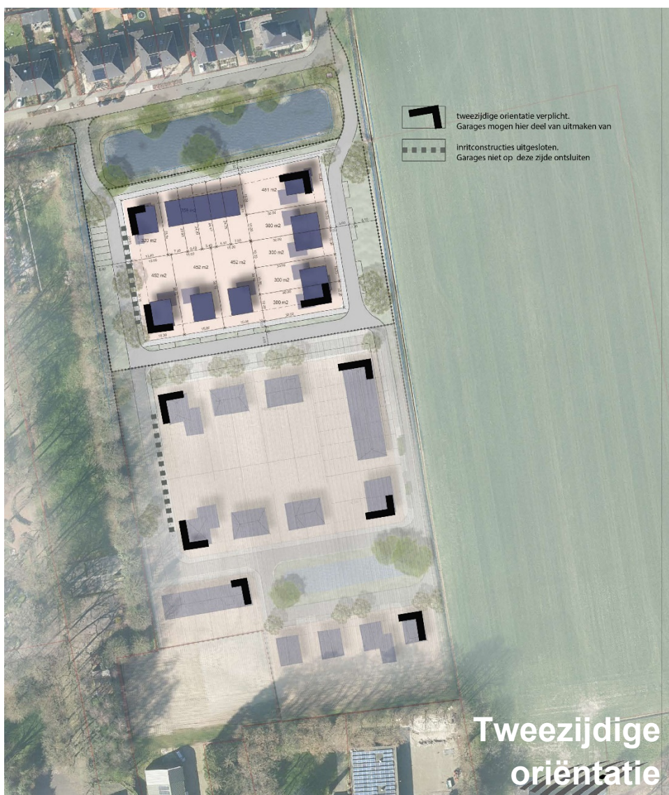
Figuur 7 Tweezijdige oriëntatie

Hoeken van rijwoningen grenzend aan de openbare ruime, maar ook van vrijstaande of twee-onder-een-kap-woningen zijn zeer bepalend voor zowel de beleving(swaarde) van de woonstraat als de sociale controle vanuit de woningen op die woonstraat. In dit plan worden daarom blinde zijgevels van hoekwoningen uitgesloten. Het doel is om het wonen achter de hoekgevel te betrekken bij het leven op straat. Er moet dus sprake zijn van een mogelijke interactie tussen binnen en buiten zonder dat de leefbaarheid binnen daarmee wordt aangetast. Dit betekent dat er minimaal sprake moet zijn van één raam in zijgevel. Afhankelijk van het type woning kan ook de voordeur aan deze zijde bijdragen aan dit doel. Garages mogen op de hoek gebouwd worden. Ook hier geldt dat geen sprak mag zijn van een blinde gevel. Garages georiënteerd met een uitrit richting de begraafplaats zijn uitgesloten. Extra detailleringen in het metselwerk (bijvoorbeeld door afwijkend kleurgebruik) kunnen de belevingswaarde nog vergroten.