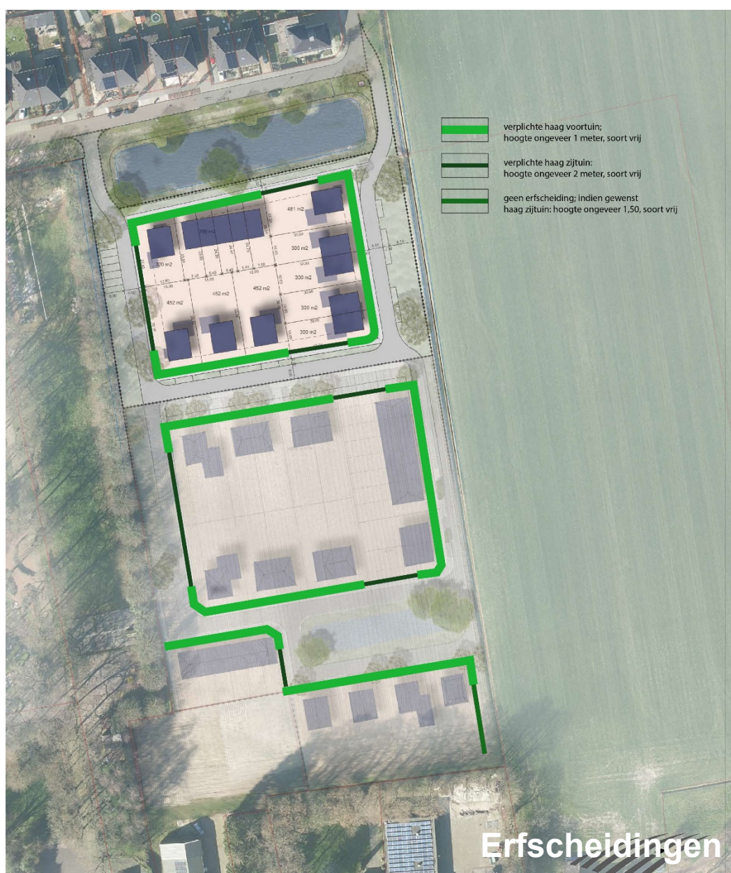
Figuur 9 Erfscheidningen

Uitzondering hierop vormt de kavel die aan de zuidoostzijde van het plan grenst aan het buitengebied. Een erfscheiding is hier niet verplicht in verband met het vrije uitzicht op het buitengebied. Indien hier toch behoefte is aan een erfscheiding, is ook hier sprake van een haag (hoogte ongeveer 1,5 meter, soort vrij).