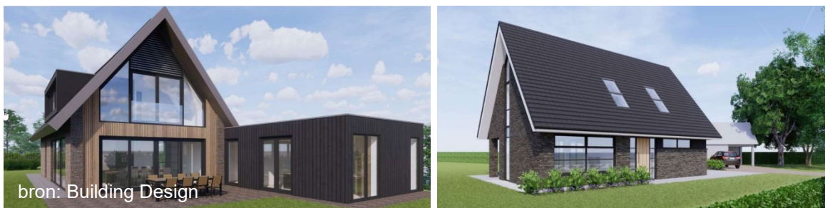
Figuur 5 referentie beelden 'eigentijdse architectuur'