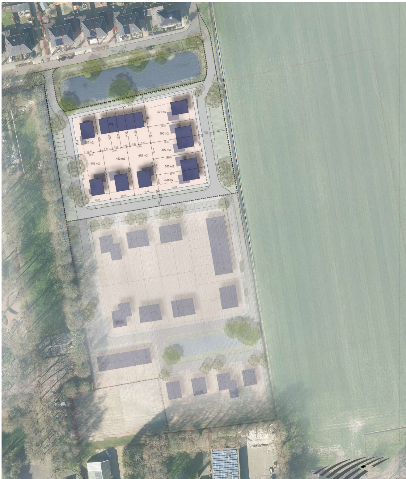
Figuur 4: Stedenbouwkundig plan met indicatieve verkaveling