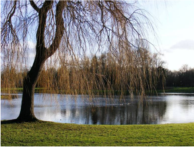
Figuur 11 Bij een vijver passende boom

In de woonstraten worden in het profiel bomen opgenomen die passen in het straatbeeld. Dit worden laanbomen, afwijkend van de solitaire bomen rond de vijvers in soort en maat (kleiner).