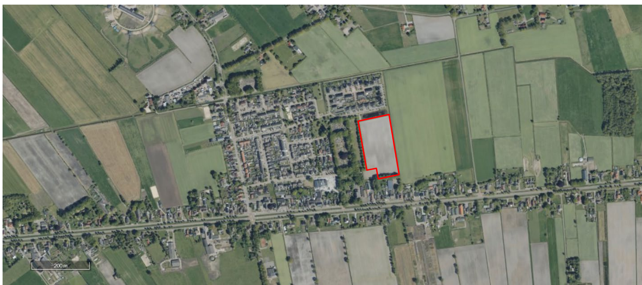
Figuur 1 Plangebied

De Wieken II vormt als woningbouwlocatie de volgende fase in de uitbreidingslocatie voor de Lutten. Voor deze fase is door de gemeente Hardenberg een stedenbouwkundig plan ontworpen, een bestemmingsplan en een beeldkwaliteitsplan opgesteld. Bij ontwerp-/ontwikkelopgaven in dit plangebied, dient dit rapport, het beeldkwaliteitsplan De Wieken II, samen met het bestemmingsplan als basis voor de gewenste ruimtelijke ontwikkeling.