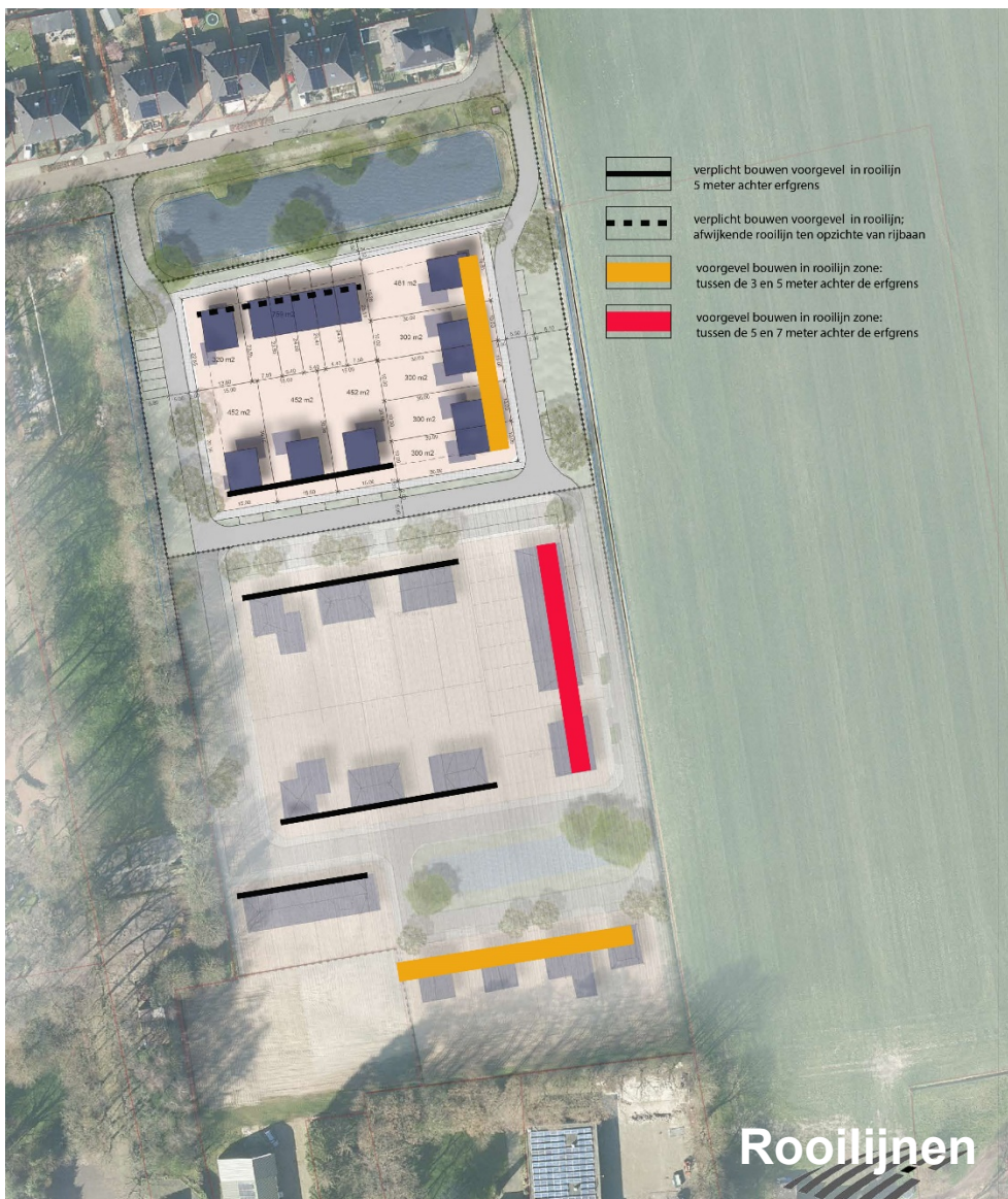
Figuur 6 Rooilijnen

In principe worden alle woningen verplicht in de rooilijn gebouwd, die 5 meter achter de erfgrans is gesitueerd. Hierdoor hebben alle woningen een ruime voortuin die past in het beeld van het dorp. Alleen in de dorpsrand is hierop een uitzondering gemaakt. De voorgevels van deze woningen aan de dorpsrand mogen binnen een vrije bandbreedte worden gerealiseerd. Deze flexibiliteit biedt de mogelijkheid om (door toeval op basis van de keuze van de bewoners) meer gewenste variatie in het aanzicht van de dorpsrand te realiseren. Daar waar het openbaar groen in het straatprofiel aanwezig is, is deze zone smaller dan waar dat niet het geval is. Hiervoor is gekozen om bij opgaande gewassen op het aangrenzende buitengebied het mogelijke profiel met ondiepe voortuinen niet te smal te maken.