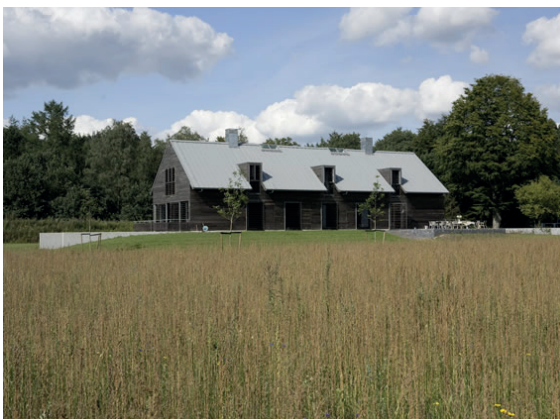
moderne architectuur en uitstraling