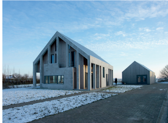
moderne architectuur en uitstraling