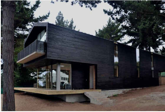
moderne architectuur en uitstraling