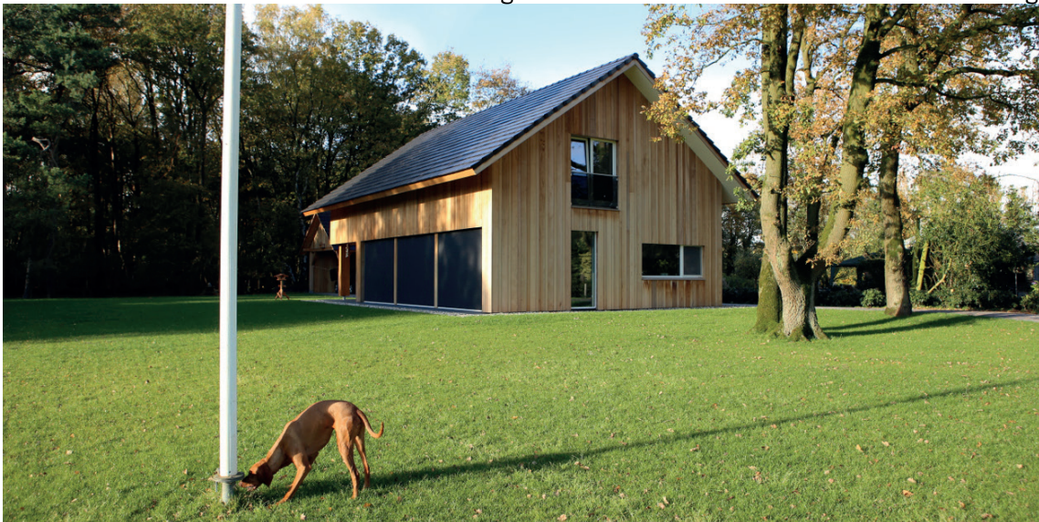
moderne architectuur en uitstraling