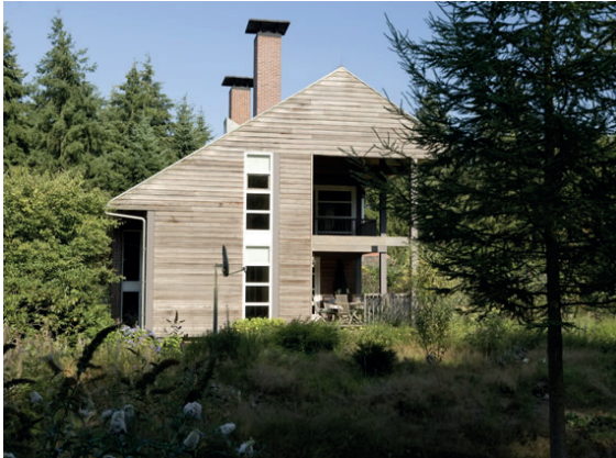
moderne architectuur en uitstraling