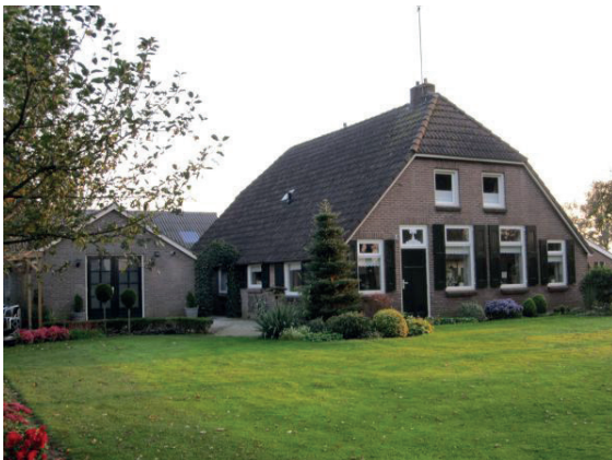
boerderij met goede gevelindeling