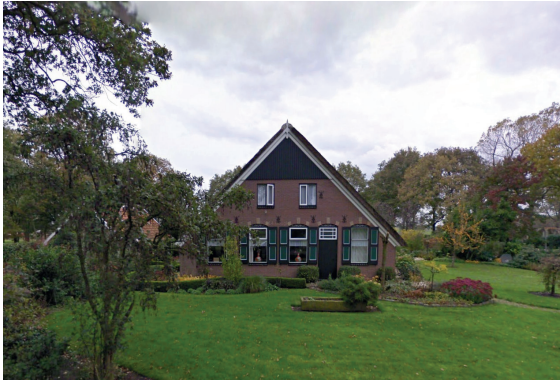
bestaande boerderij, Anerveenseweg 66