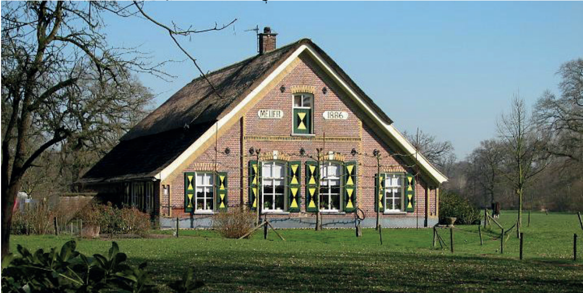
boerderij met zadeddak