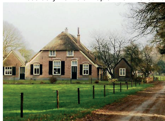
boerderij met rieten kap en klein wolfseind