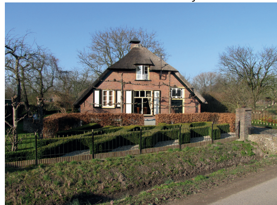
boerderij met rieten kap en klein wolfseind