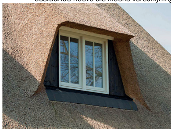
ingedekte dakkapel van beperkte omvang