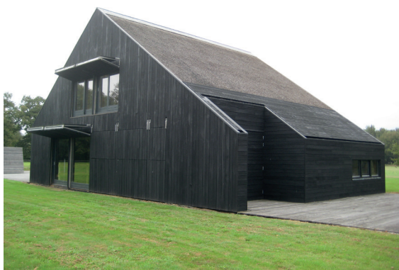
nieuwe moderne hoeve op het landgoed