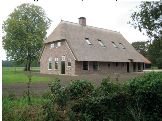
nieuwe traditionele hoeve op het landgoed