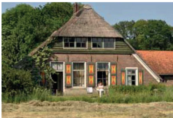
bestaande hoeve als referentie