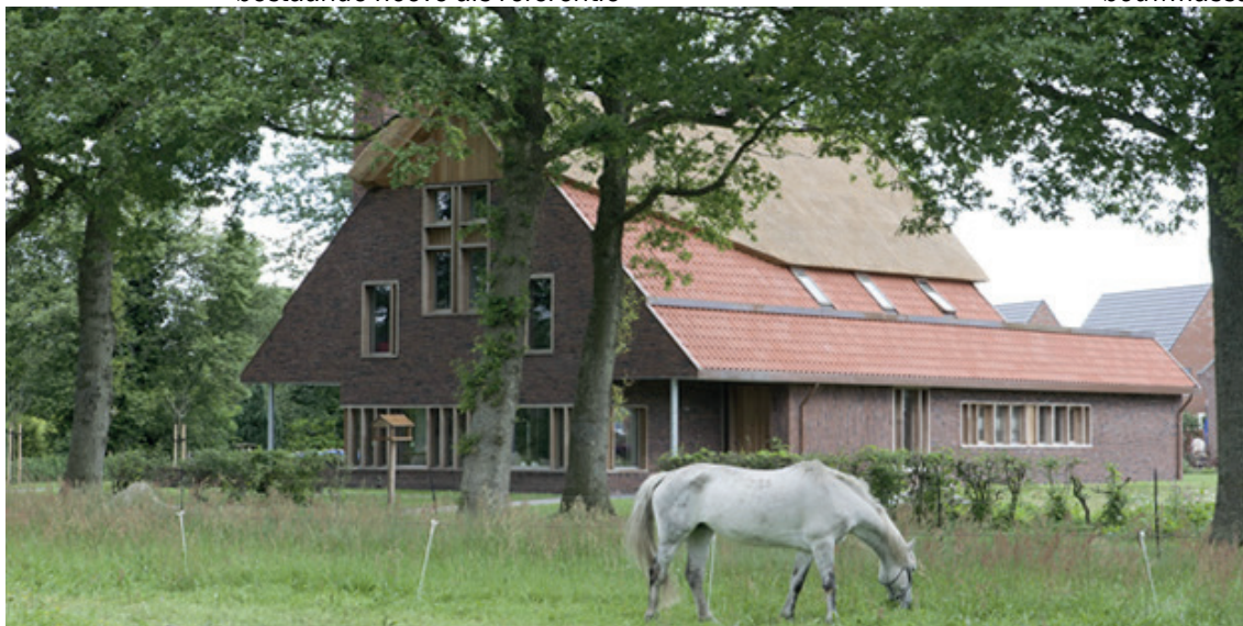
bestaande hoeve als kloeke verschijning