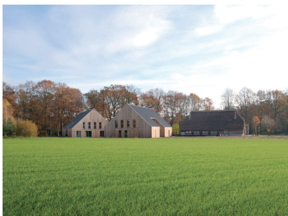
nieuwe hoeve in het landschap