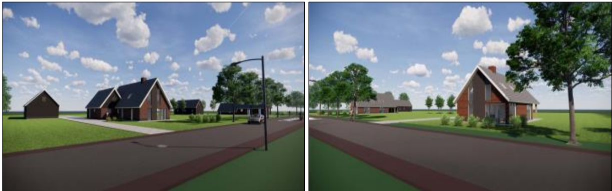
Verbeelding van het wenselijke eindbeeld.

Het voornemen bestaat om twee nieuwe woningen en schuren te bouwen in het plangebied. Om dit te kunnen realiseren is het plan om alle bebouwing in het plangebied te slopen, erfverharding te verwijderen en diverse beplanting te rooien. Om de woningen en schuren te kunnen bouwen, worden de bouwlocaties bouwrijp gemaakt. Op onderstaande afbeeldingen wordt het wenselijke eindbeeld weergegeven.