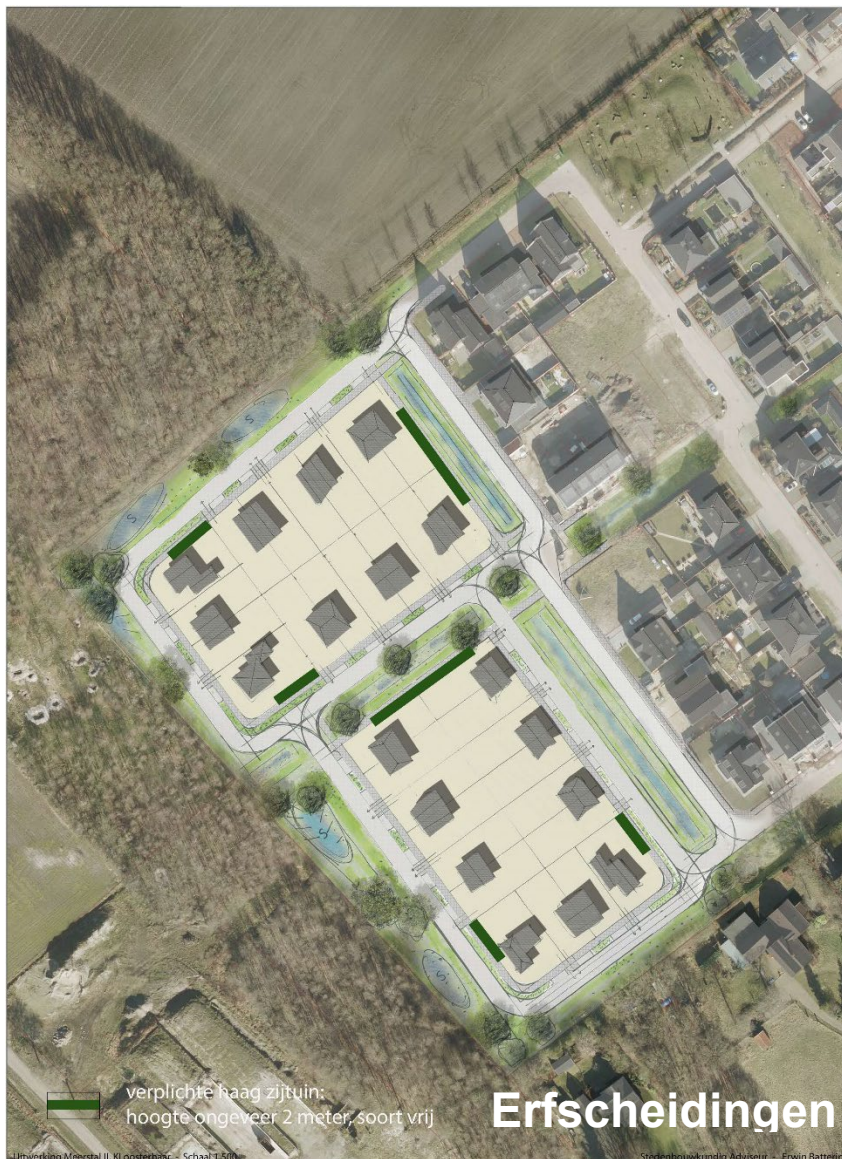
Figuur 8 Efscheidingen

In of grenzend aan de groene efscheiding is het mogelijk een tuindeur te plaatsen zodat een zijingang tot de tuin mogelijk wordt. Dit is mogelijk indien deze direct aansluit op een openbaar trottoir of rijbaan. In alle andere gevallen kan een dergelijke toegang pas mogelijk gemaakt na overleg met en toestemming van de gemeente zodat ongewenste situaties (zoals een zij-ingang uitkomend op een parkeerplek of een openbare groenstrook) voorkomen kunnen worden.