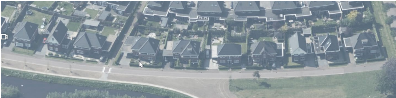
Figuur 7 haaks of evenwijdige nokrichtingen mogen elkaar afwisselen ten behoeve van de gewenste variatie

In een kap is het mogelijk accenten aan te brengen (bijvoorbeeld in de vorm van dakkapellen of haaks op de nokrichting staande kapjes).