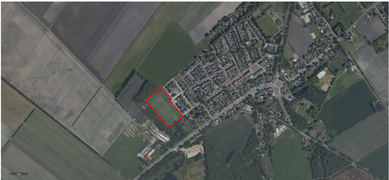
Figuur 1 Globale markering plangebied

Meerstal II vormt de volgende fase in de uitbreidingslocatie voor Kloosterhaar. Voor deze fase is door de gemeente Hardenberg een stedenbouwkundig plan ontworpen, een bestemmingsplan en een beeldkwaliteitsplan opgesteld. Bij ontwerp-/ontwikkelopgaven in dit plangebied, dient dit rapport, het beeldkwaliteitsplan Meerstal II, samen met het bestemmingsplan als basis voor de gewenste ruimtelijke ontwikkeling.