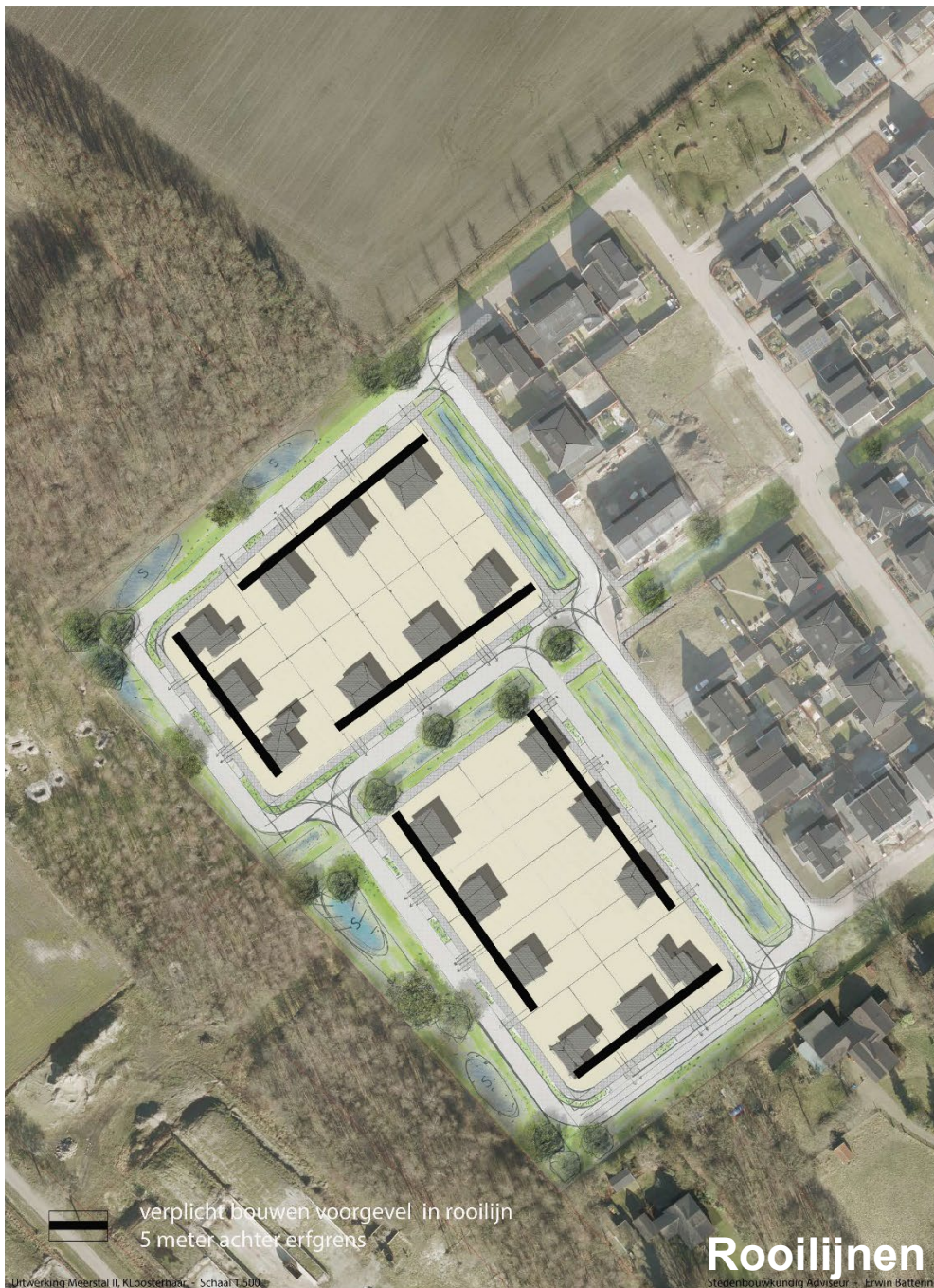
Figuur 5 Rooilijnen

Alle woningen worden verplicht in de rooilijn gebouwd. Deze is gelegen op 5 meter achter de erfrens. Op deze wijze wordt de blokverkaveling met de rechte en orthogonale lijnen versterkt doordat ook de hoofdgebouwen in zichtbare rechte lijnen zijn geplaatst.