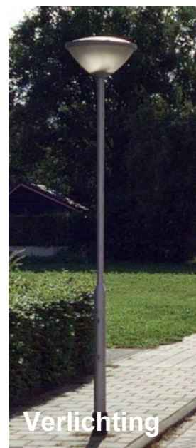
Figuur 9 materialisering Meerstal fase 1