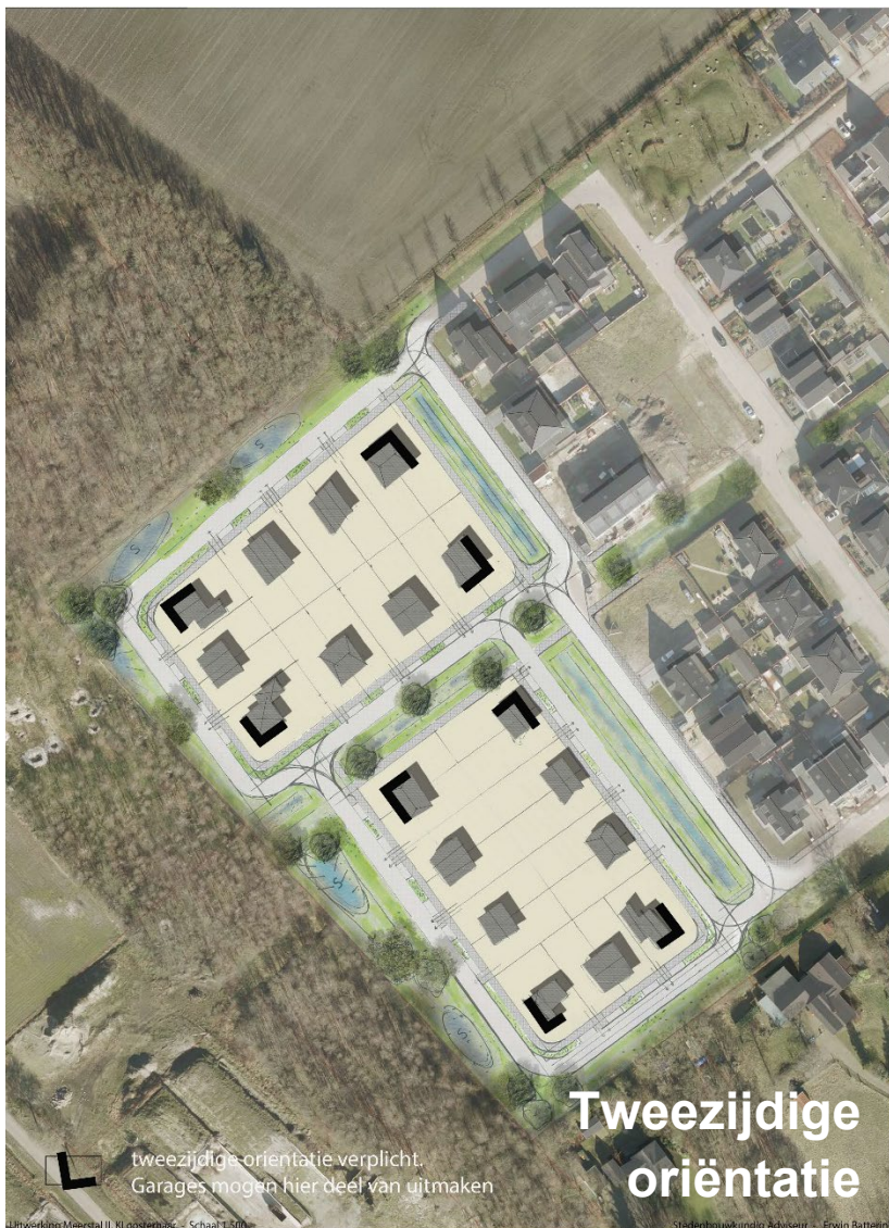
Figuur 6 Tweezijdige oriëntatie

Extra detailleringen in het metselwerk (bijvoorbeeld door afwijkend kleurgebruik) kunnen de belevingswaarde nog vergroten.