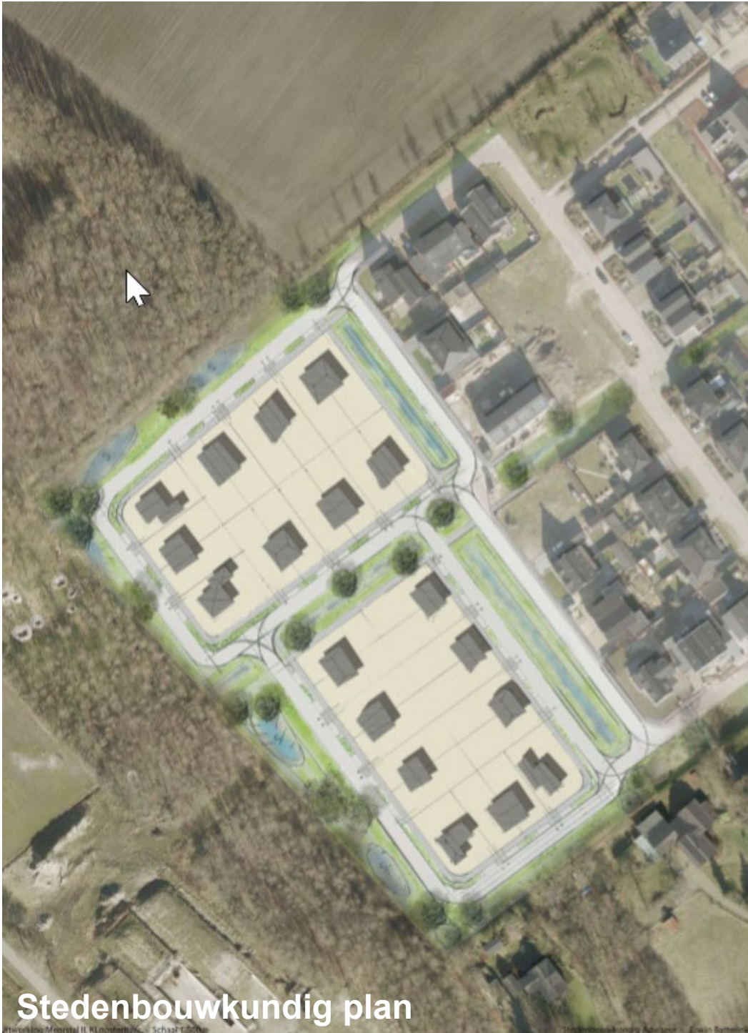
Figuur 4 Stedenbouwkundig plan met indicatieve verkaveling

daar slechts sprake van een trottoir aangezien hier de zijanten van woningen op deze zone georiënteerd zijn. In dit plan wordt het regenwater zichtbaar afgekoppeld.