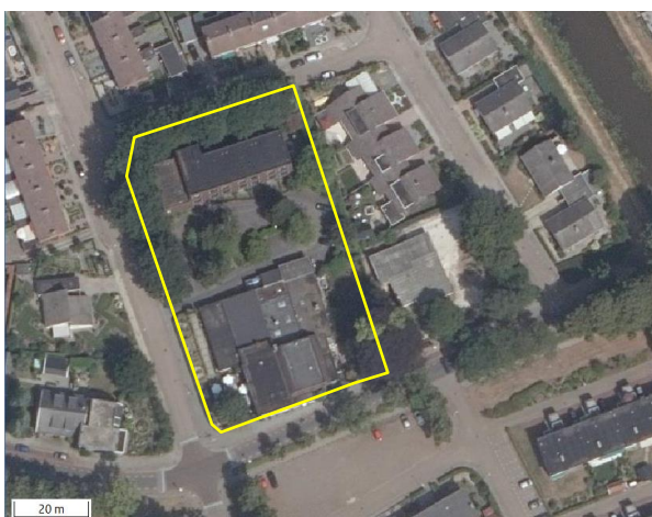
Detailopname van het plangebied. De begrenzing van het plangebied wordt met de gele lijn aangeduid.

In het plangebied staan een hotel en een gebouw met horecafunctie (Hotel de Bokkepruik), omgeven door een tuin met bomen, struiken en heesters. Het hotelgebouw, gelegen aan de noordzijde van het plangebied, is gebouwd van bakstenen en gedekt met dakleer. Ook delen van de zijgevels zijn als het ware bekleed met dakleer. De hotelkamers beschikken over een loggia. Het horecagebouw, aan de zuidzijde van het plangebied, is gebouwd van bakstenen en heeft deels een plat dak en deels een met dakleer beklede zijgevel. Op delen van het gebouw is een brede boeiboord aangebracht. De gebouwen verkeren in redelijke staat van onderhoud; ze zijn wind- en waterdicht. Op onderstaande afbeelding wordt de begrenzing van het plangebied weergegeven.