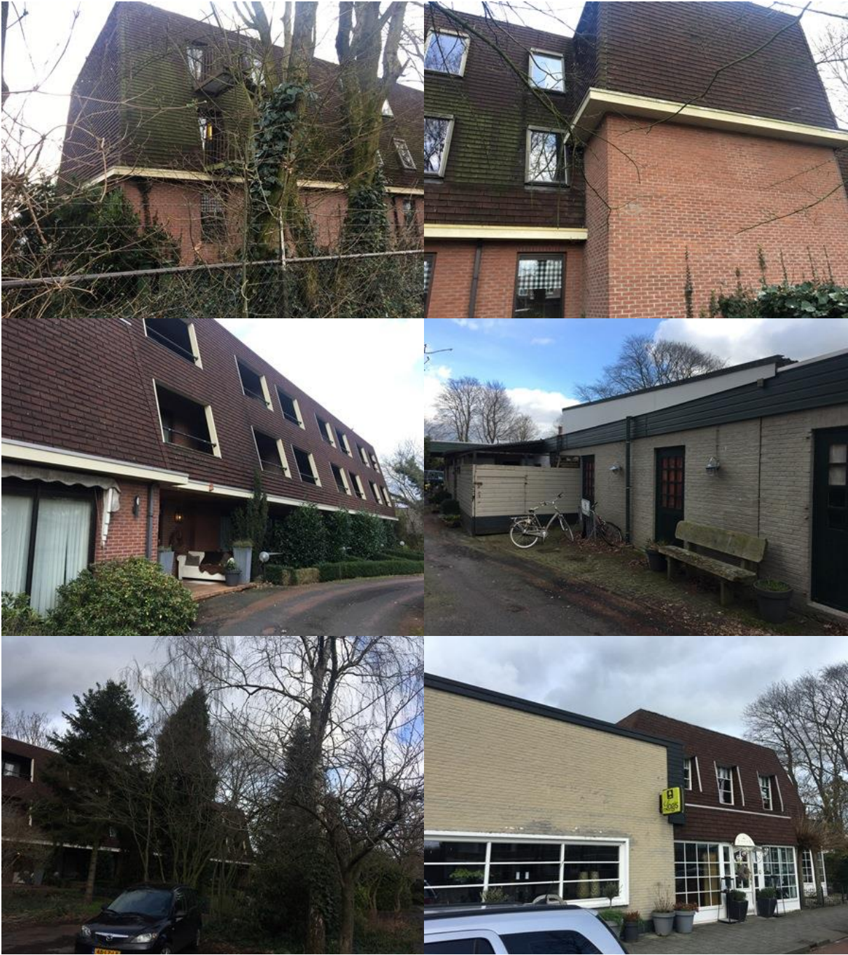
Bijlage 3. Fotobijlage. Impressie van het plangebied en de directe omgeving.