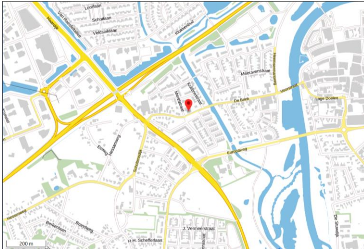
Globale ligging van het plangebied. De ligging van het plangebied wordt met de rode marker aangeduid.

Het plangebied bestaat uit een perceel, gelegen tussen de Hessenweg en de Spechtstraat te Hardenberg en bestaat uit de adressen Hessenweg 7 en Merelstraat 1. Het ligt in de woonkern Hardenberg en wordt omgeven door stedelijk gebied. Op onderstaande afbeelding wordt de globale ligging van het plangebied weergegeven op een topografische kaart.