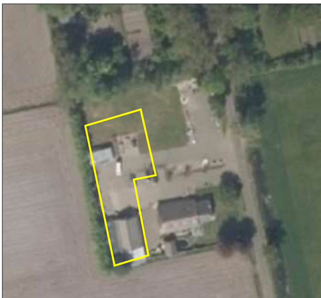
Begrenzing van het plangebied wordt met de gele lijn aangeduid.

Het plangebied bestaat uit een werkplaats, verharding, gazon en er liggen goederen/materialen (bestaande uit o.a. oud ijzer, plastic en pallets) verspreid in het plangebied. Tevens staan er twee aanhangwagens, containers en een steiger met goederen in de buitenruimte van het plangebied. De werkplaats beschikt over een afdak aan de zuidzijde. Het afdak is open en er liggen bouwmaterialen in verspreid en er staat een voertuig in geparkeerd. De werkplaats beschikt over gemetselde buitengevels met luchtspouw en over dakisolatie. De voor- en achtergevel van de werkplaats zijn deels met hout betimmerd. Zowel de werkplaats als het afdak zijn gedekt met golfplaten. De verharding in het plangebied vormt parkeerterrein en gelegenheid voor laden/lossen. Op onderstaande afbeelding wordt de begrenzing van het plangebied weergegeven. Voor een verbeelding van de huidige situatie wordt verwezen naar de fotobijlage.