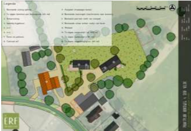
Weergave van het wenselijke eindbeeld.

Het voornemen bestaat om alle bebouwing in het plangebied te slopen (inclusief deel van de werktuigenberging aan de zuidzijde van het erf) en twee woningen met bijgebouw op te richten. Het nieuwe erf wordt nadien landschappelijk ingepast. Op onderstaande afbeelding wordt het wenselijke eindbeeld weergegeven.