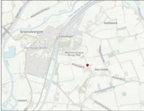
Globale ligging van het plangebied. De ligging van het plangebied wordt met de rode marker aangeduid.

Het plangebied is gesitueerd aan de Rondweg 4 in Den Velde, gemeente Hardenberg. Het ligt in het buitengebied, circa één kilometer ten oosten van de woonkern Gramsbergen. Op onderstaande afbeelding wordt de globale ligging van het plangebied weergegeven op een topografische kaart.