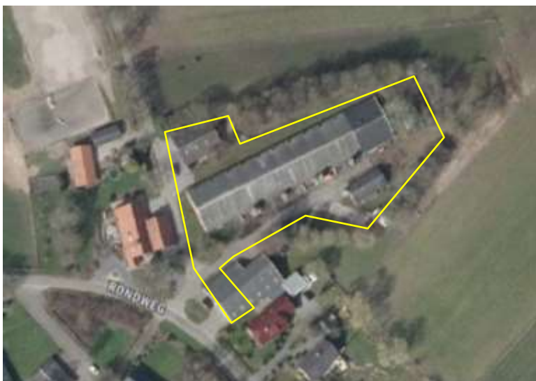
Detailopname van het plangebied. De begrenzing van het plangebied wordt met de gele lijn aangeduid (bron luchtfoto: pdok).

Het plangebied vormt een deel van een agrarisch erf waarop een varkensbedrijf is gevestigd. Het plangebied bestaat uit bebouwing, erfverharding en opgaande beplanting. In het plangebied staan een grote en een kleine varkensstal, twee schuren (werktuigenbergingen) en een mestsilos. De bebouwing is gebouwd van bakstenen en is gedekt met golfplaten. De varkensstallen en de zuidelijke schuur beschikken over dakisolatie in de vorm van PIR-platen die onder de gording zijn bevestigd. De noordelijke schuur heeft geen dakisolatie. De gebouwen verkeren in een redelijke staat van onderhoud. De daken zijn waterdicht, maar de PIR-platen in de meest zuidelijke schuur, zijn gedeeltelijk losgeraakt van de gording. Rond de mestsilos en de varkensstal staat opgaande beplanting, bestaande uit bomen en struiken. Aan de noordgevel van de kleine stal groeit klimop (hedera). Op onderstaande luchtfoto wordt het plangebied in detail weergegeven, evenals de begrenzing. Voor een impressie van het plangebied wordt verwezen naar de fotobijlage.