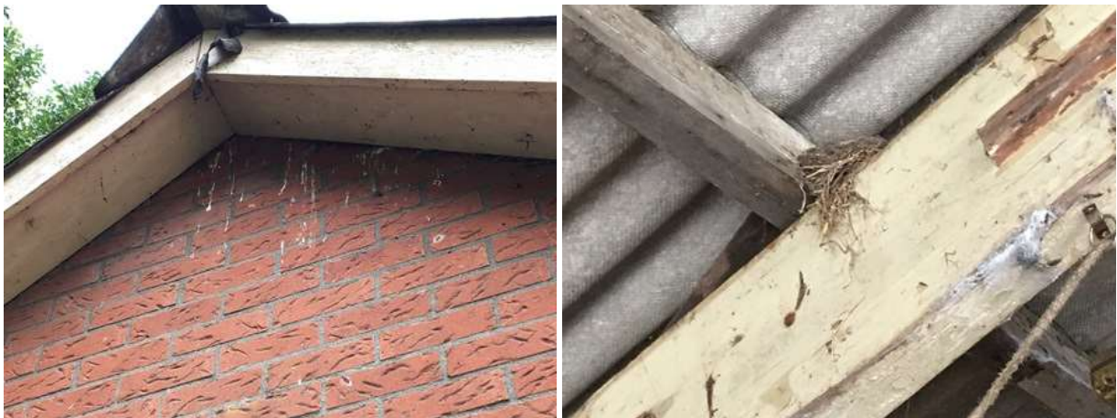
Foto links: schijfsporen van de spreeuw; indicatie voor een nestplaats. Foto rechts: oud nest van de merel.

Het plangebied behoort tot functioneel leefgebied van verschillende vogelsoorten. Vogels benutten de buitenruimte van het plangebied als foerageergebied en er nestelen vermoedelijk ieder voortplantingsseizoen vogels in het plangebied. Vogels kunnen nestelen in bomen, struiken, klimop en in toegankelijke gebouwen. Er zijn tijdens het onderzoek aanwijzingen gevonden dat spreeuwen in de kleine varkensstal nestelen en in de klimop aan de kleine varkensstal. Vermoedelijk een solitaire kerkuil, bezet een rustplaats in de holle ruimte onder de golfplaten in de zuidelijke schuur, net buiten het plangebied. Aan de kleine varkensstal zijn restanten van oude nesten van de huiszwaluw zichtbaar op de buitenzijde van de muur. Andere vogelsoorten die mogelijk in het plangebied nestelen zijn merel, tjiftjaf, vink, houtduif, zwartkop. Er zijn tijdens het bezoek geen huismussen aangetroffen. Het plangebied wordt niet als een geschikte nestlocatie voor huismussen beschouwd. Daarnaast zijn in het plangebied geen oude nesten van roofvogels of uilen waargenomen, zoals sperwer, buizerd of ransuil.