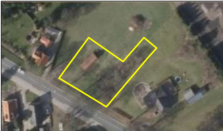
Detailopname van het plangebied. De begrenzing van het plangebied wordt met de gele lijn aangeduid.

Het plangebied bestaat uit een veldschuur, agrarisch cultuurland (grasland) en opgaande beplanting in de vorm van struiken (incl. ruigte) en bomen (o.a. meidoorn en lijsterbes). De veldschuur is gebouwd van hout en bedekt met dakpannen. Het plangebied grenst aan noord-, west en oostzijde aan agrarisch grasland, en aan de zuidzijde aan een bomenlaan en openbare ruimte (Groenedijk). Op onderstaande luchtfoto wordt de ligging van het plangebied op een luchtfoto weergegeven. Open water ontbreekt in het plangebied. Voor een impressie van het plangebied wordt verwezen naar de fotobijlage.