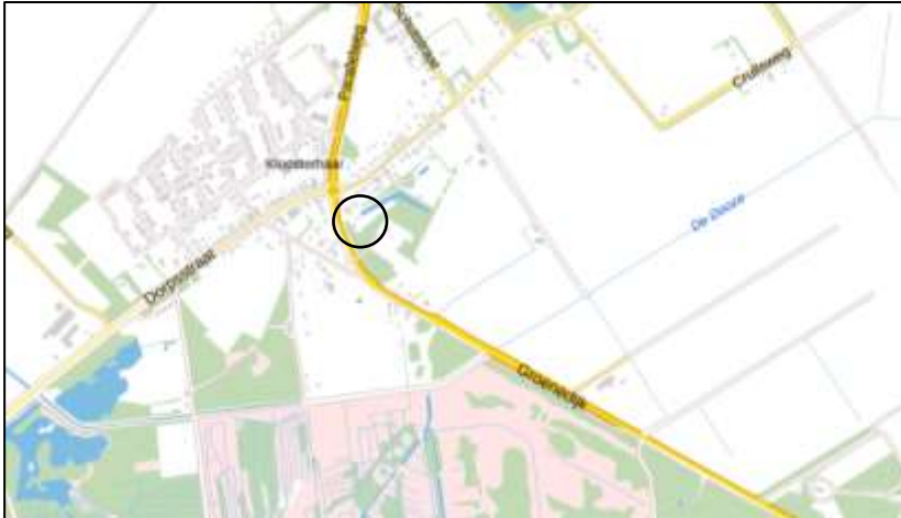
Globale ligging van het plangebied. De ligging van het plangebied wordt met de cirkel aangeduid (bron kaart: PDOK).

Het plangebied is gesitueerd aan de Groenedijk 9-11 te Kloosterhaar en ligt in het buitengebied ten zuidoosten van de woonkern Kloosterhaar. Op onderstaande afbeelding wordt de globale ligging van het plangebied weergegeven op een topografische kaart.