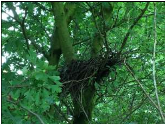
Oud houtduivennest in een meidoorn in het plangebied.

Het plangebied behoort tot functioneel leefgebied van verschillende vogelsoorten. Vogels benutten het plangebied als foerageergebied en er nestelen vermoedelijk ieder voortplantingsseizoen vogels in het plangebied. Vogelsoorten die mogelijk in het plangebied nestelen zijn merel, zanglijster, spreeuw, zwartkop, tjiftjaf, koolmees, pimpelmees, staartmees, heggenmus, roodborst, winterkoning, vink, houtduif en Turkse tortel. Vogels kunnen nestelen in de veldschuur en in bomen en struiken in het plangebied. Het agrarisch cultuurland (grasland) wordt niet als een geschikte nestlocatie voor vogel beschouwd. Er zijn tijdens het bezoek geen huismussen aangetroffen. De ligging buiten stedelijk gebied maakt het een ongeschikte nestlocatie voor gierzwaluwen. Daarnaast, zijn in het plangebied geen oude nesten van roofvogels of uilen waargenomen, zoals steenuil of ransuil.