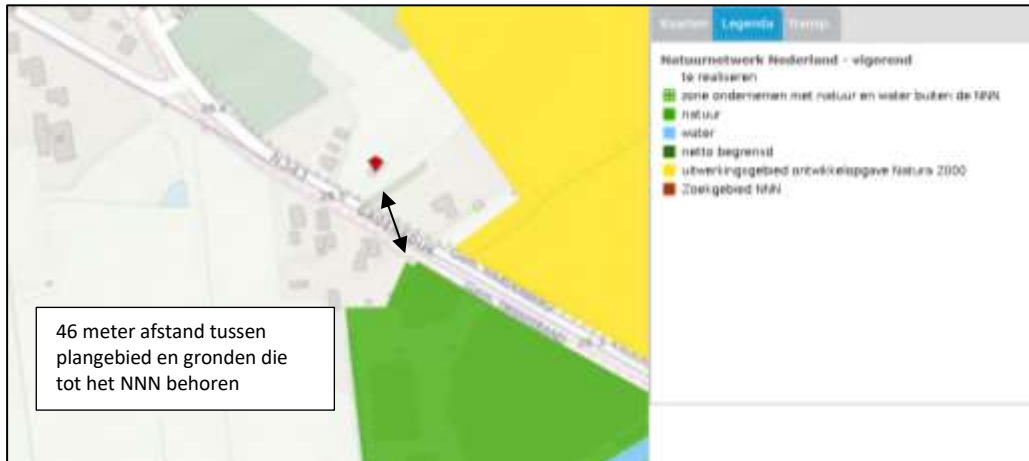
Ligging van Natuurnetwerk Nederland in de omgeving van het plangebied. Gronden die tot het Natuurnetwerk Nederland behoren worden met de donkergroene en gele kleur op de kaart aangeduid. De ligging van het plangebied wordt met de rode marker aangeduid