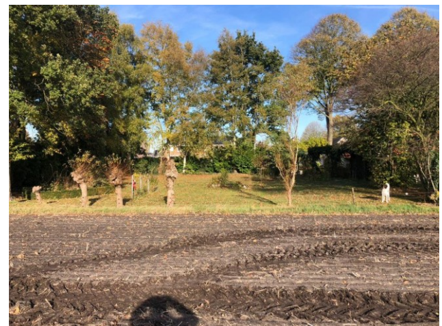
Alle bomen vanuit achterliggen akkerlang gezien.