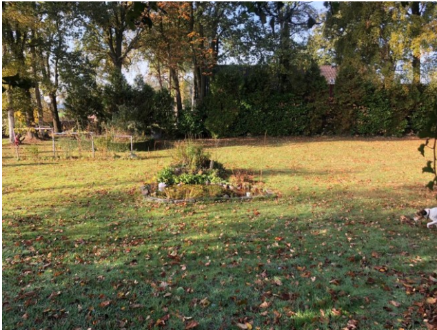
boom nummer 1 t/m 9