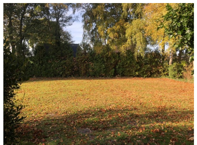
boom nummer 5 t/m 15