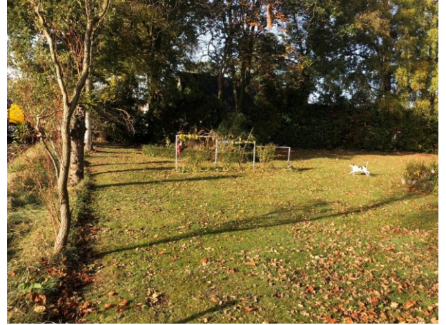
boom nummer 1 t/m 13