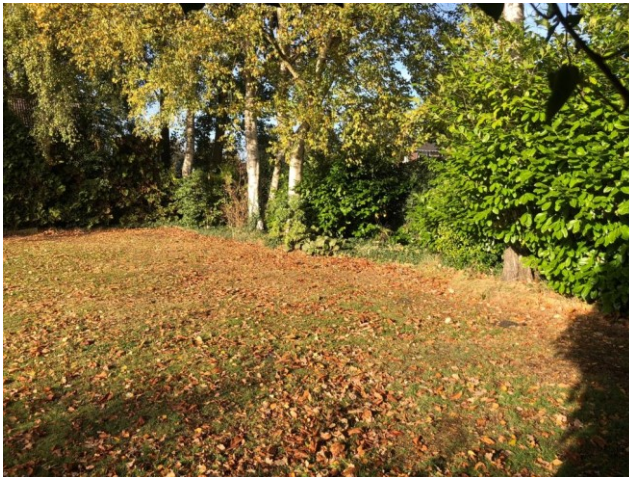
boom nummer 13 t/m 17