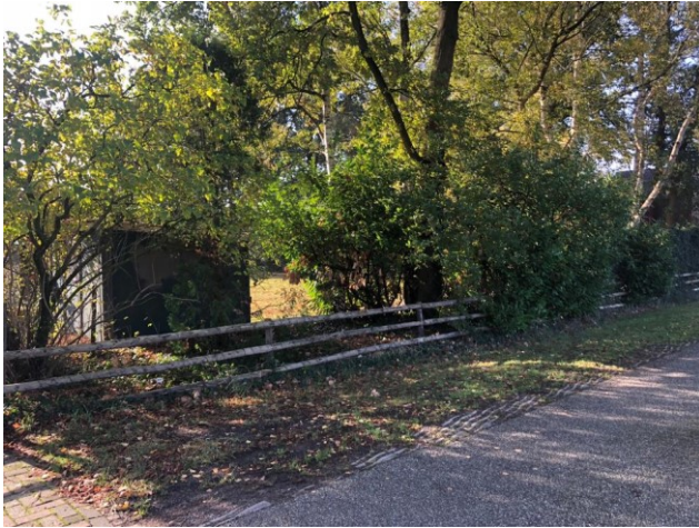
boom nummer 18