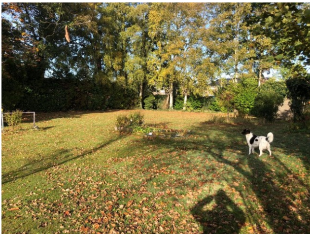
boom nummer 11 t/m 17