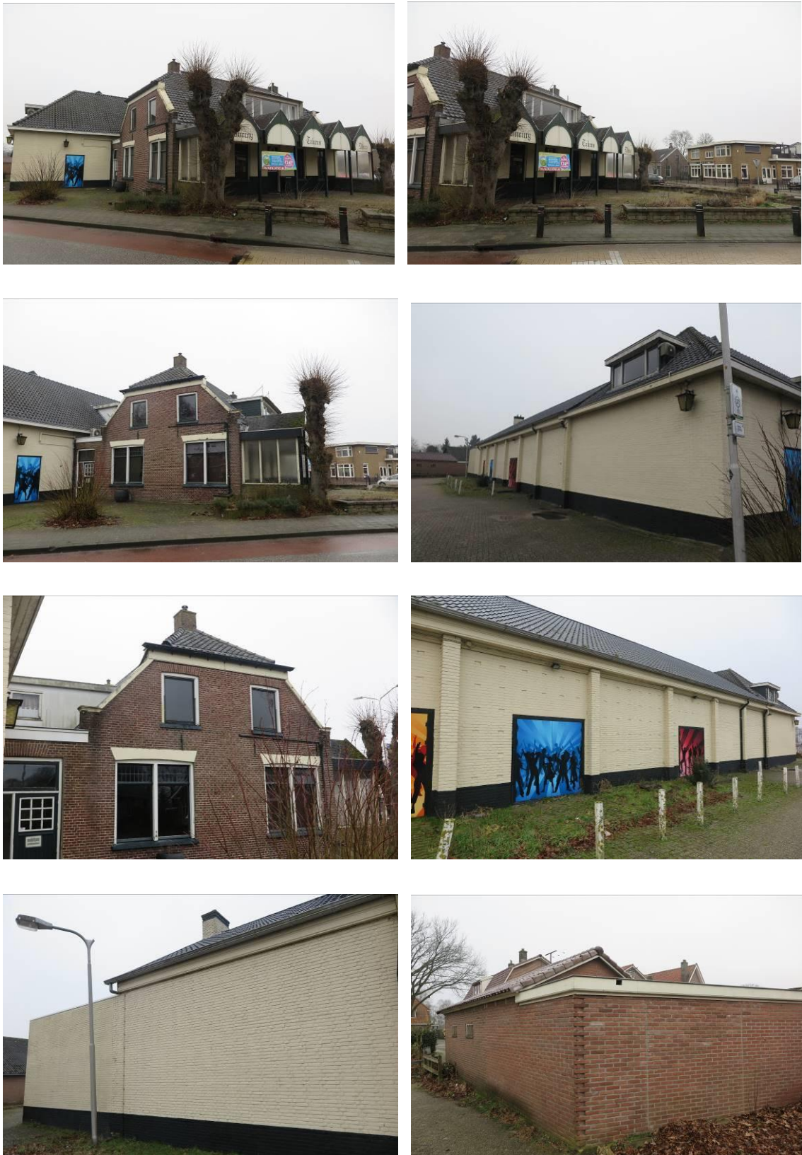
Figuur 2. Foto-impresie van het plangebied in de Splitsing tussen de Meppelerweg en de Hoogeveenseweg te Balkbrug.