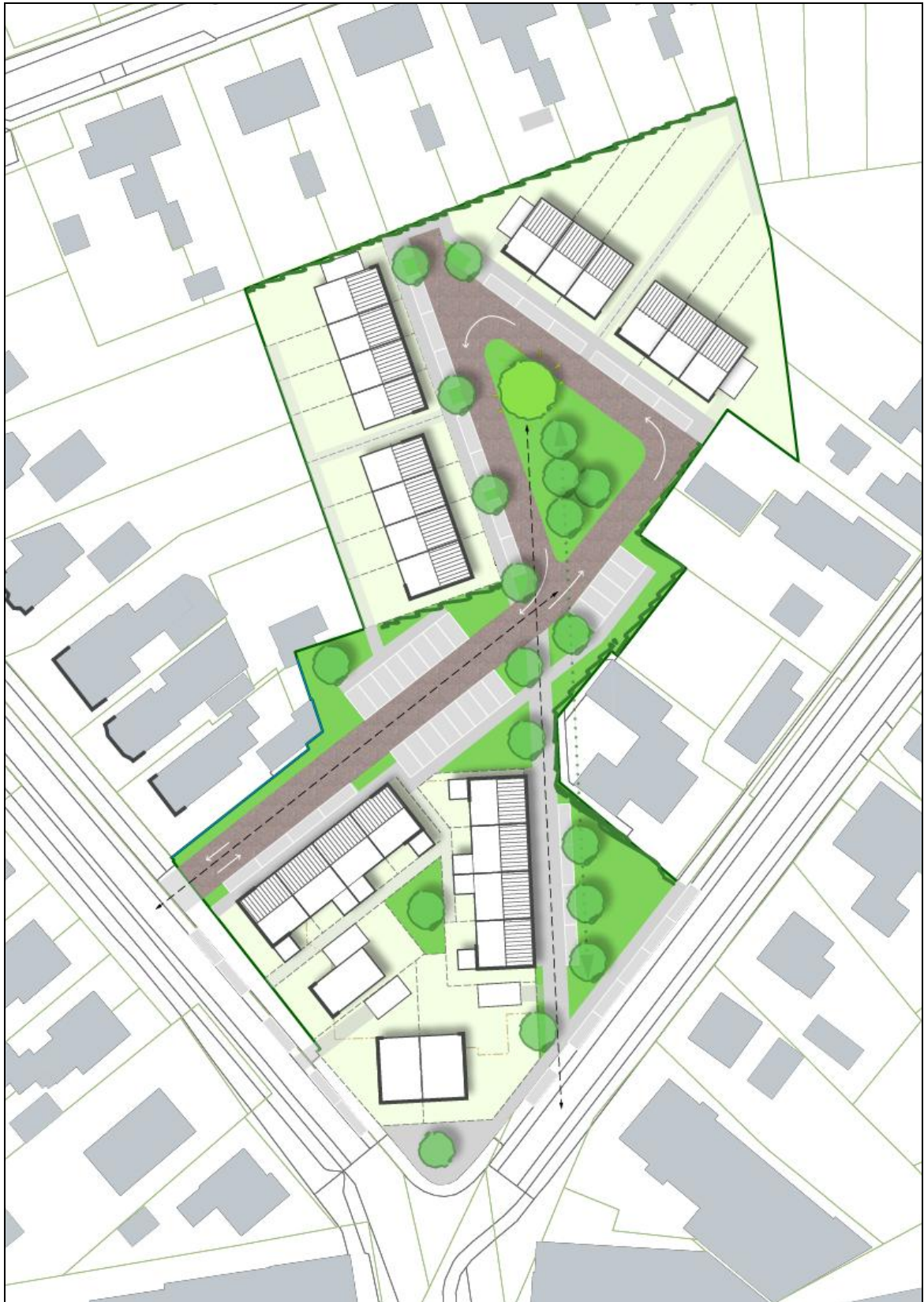
Figuur 2. Impressie van de plannen van in de splitsing tussen de Meppelerweg en de Hoogeveenseweg te Balkbrug.