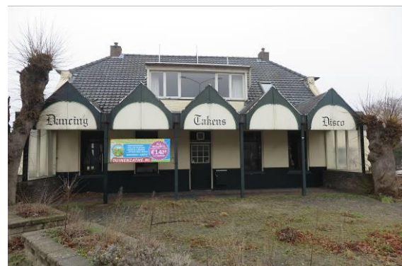
Vervolg figuur 2. Foto-impressie van het plangebied in de splitsing tussen de Meppelerweg en de Hoogeveenseweg te Balkbrug.