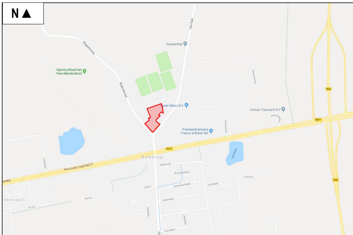
Figuur 1. Globale ligging van het plangebied in de splitsing tussen de Meppelerweg en de Hoogeveenseweg te Balkbrug.

Het plangebied is gelegen in de splitsing tussen de Meppelerweg en de Hoogeveenseweg te Balkbrug (zie figuur 1 en bijlage 1 voor de exacte ligging en begrenzing). Dit gebied bestaat uit een disco met verhard parkeerterrein. De opstallen zijn dubbelsteens en bedekt met dakpannen aan de zuidzijde en de rest met bitumen. Het voornemen is om deze opstallen te slopen, uitgezonderd het voormalig woonhuis. Het voornemen is om dit voormalig woonhuis weer om te vormen tot woning. Het dak van het gebouw dat blijft behouden; blijft er gewoon op. Het voormalig woonhuis is een interne verbouwing. Na sloop is het plan om woningbouw te realiseren/ Met de realisatie van de plannen worden geen sloten of ander oppervlaktewater beïnvloed. In figuur 2 wordt een beeld gegeven van het plangebied op donderdag 15 februari 2018 en in figuur 5 wordt een beeld gegeven van de plannen.