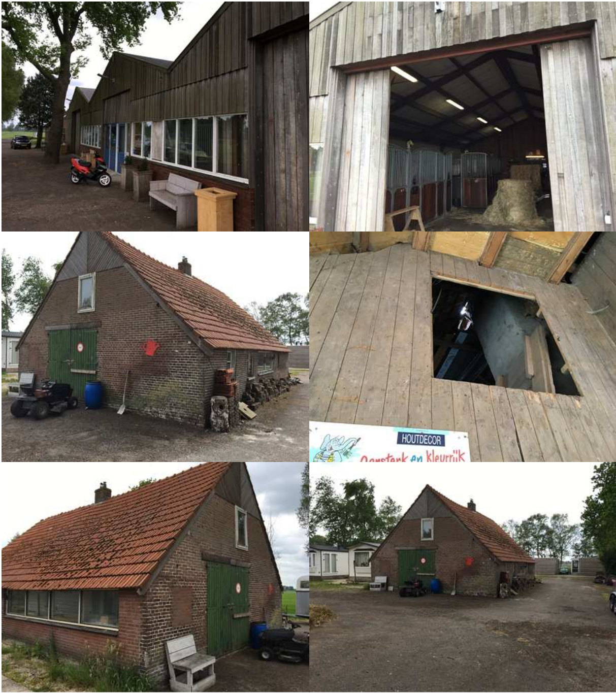
Bijlage 3. Fotobijlage. Impressie van het plangebied en de directe omgeving.