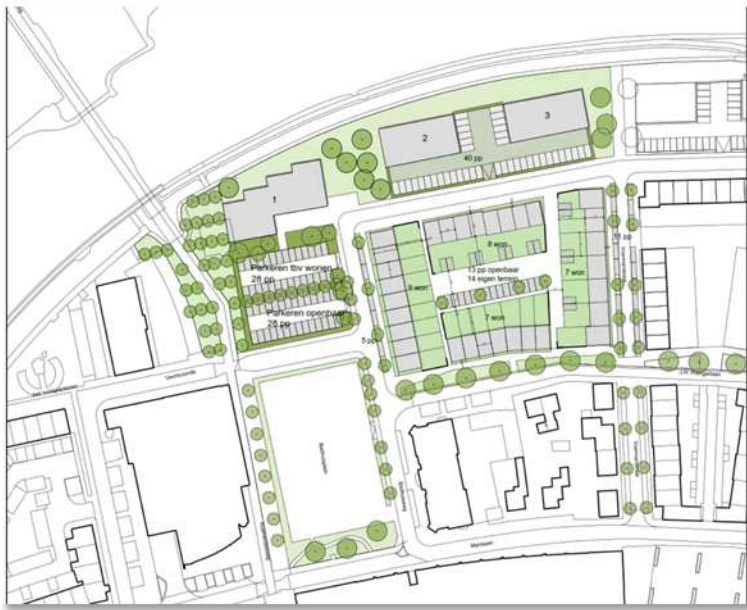
Uitsnede van de bestemmingsplankaart waarop de wenselijke inrichting wordt aangegeven.

De voorgenomen plannen bestaan uit het ontwikkelen van het noordelijke deel van het plangebied als woningbouwlocatie. Naast grondgebonden woningen worden er vier appartementencomplexen gebouwd en parkeerplaatsen aangelegd. Om de wenselijke ontwikkeling mogelijk te maken wordt het clubgebouw van kanovereniging Hardenberg-Vecht gesloopt. Op onderstaande afbeelding wordt de wenselijke herinrichting van het plangebied gepresenteerd.