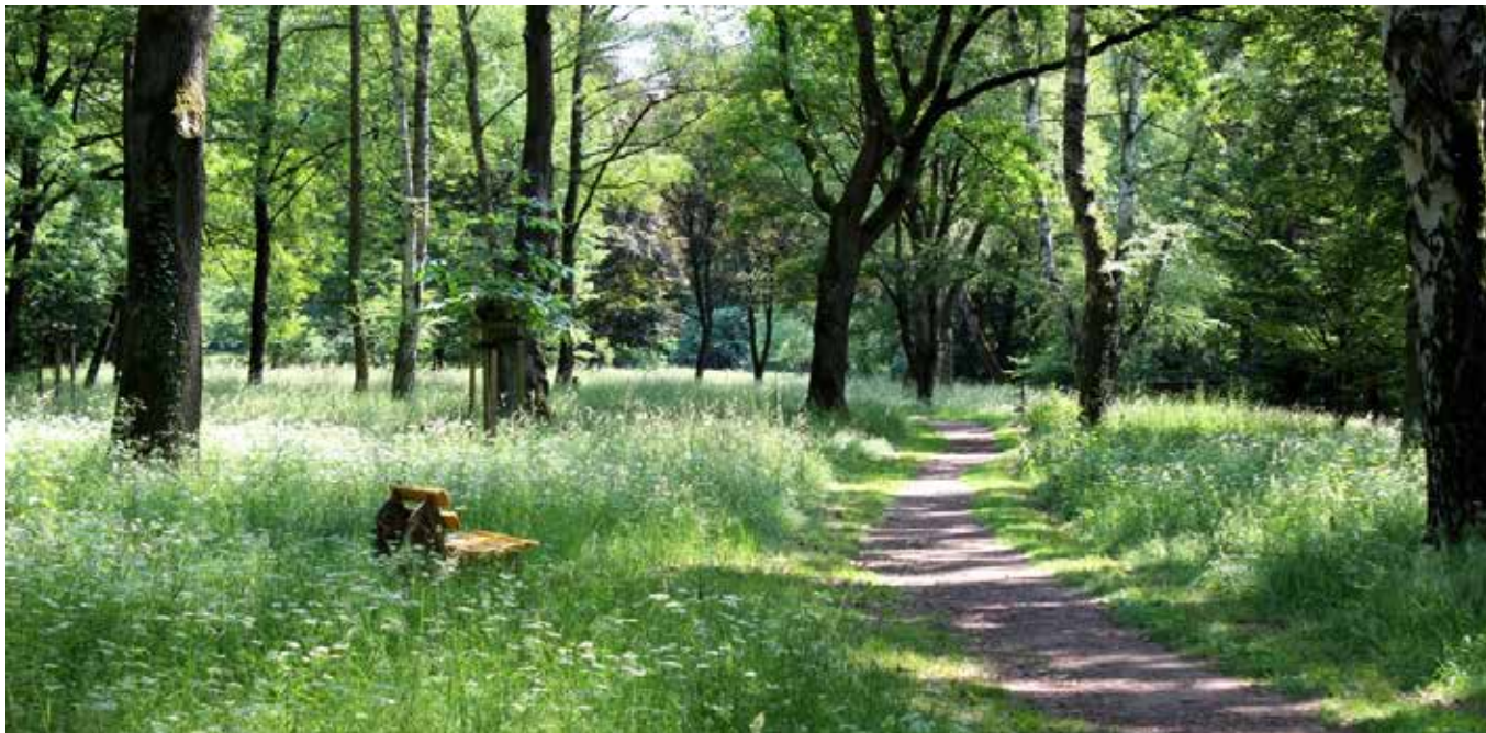
BEOOGD EINDBEELD NA DUNNEN BOS