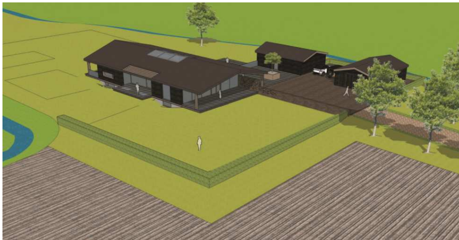
Wenselijke nieuwe situatie.

Op onderstaande afbeelding wordt een verbeelding van het nieuwe erf weergegeven.