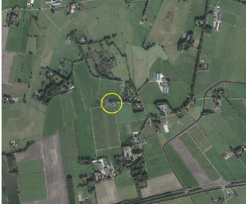
Globale ligging van het plangebied in de omgeving. Het plangebied wordt met de cirkel aangeduid.

Het plangebied is gesitueerd op het adres Noord Stegeren 52 in Dedemsvaart. Het ligt in het buitengebied, circa 1 kilometer ten noorden van de kern Dedemsvaart. Op onderstaande afbeelding wordt de globale ligging van het plangebied weergegeven met de cirkel.