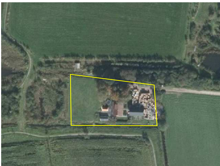
Detailopname van het plangebied. Het plangebied wordt met de lijn aangeduid.

Het plangebied bestaat uit erfverharding, bebouwing, gazon, opgaande bomen en sierplanten. Het betreft een woonerf, omgeven door gronden met een natuur- of extensief agrarische functie. Op het erf staan een woning en een garage. Beide gebouwen zijn gebouwd met bakstenen, zijn gedekt met gebakken dakpannen en beschikken over een geïsoleerde spouw (steen- of glaswol). Op onderstaande luchtfoto wordt het plangebied meer in detail weergegeven.