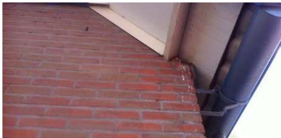
Schijsporen op de muur onder en invlieggat; indicatie voor een spreeuwennest.

Er zijn tijdens het veldbezoek verschillende broedvogelsoorten waargenomen in het plangebied waaronder merel, tjiftjaf, vink, spreeuw, koolmees en zwartkop. Deze soorten nestelen mogelijk in de bebouwing, nestkasten, bomen, struiken of op de grond tussen dichte vegetatie. In de schuur nestelt de spreeuw. Er zijn op het erf geen huismussen waargenomen.