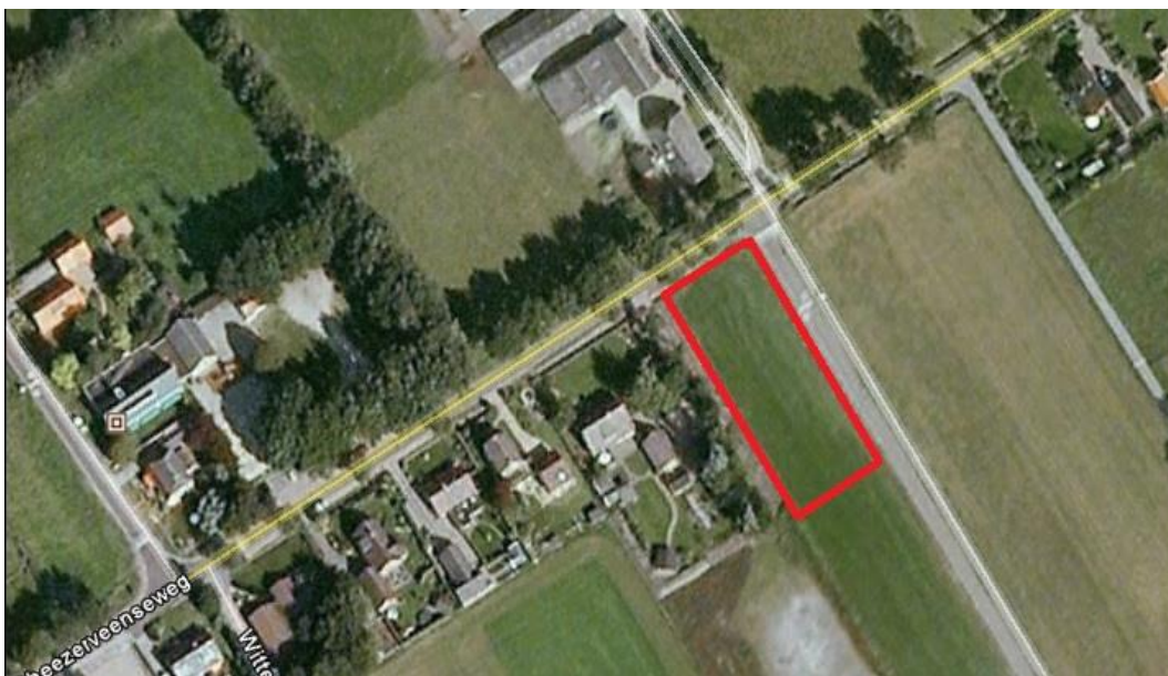
Figuur 1.1: Locatie plangebied (rood omlijnd).

Voor een agrarisch perceel op de hoek van de Rheezeerveenseweg en de Bosrandweg in Rheezeerveen bestaan herontwikkelingsplannen. Op het agrarisch perceel wordt een woning ontwikkeld. Voor deze herontwikkeling is een bestemmingswijziging nodig en in dat kader is in opdracht van Aveco de Bondt een verkennend natuuronderzoek uitgevoerd om de effecten van het voorgenomen plan op beschermde natuurwaarden in beeld te brengen. Voorliggend rapport bevat de uitkomsten van het verkennend natuuronderzoek.