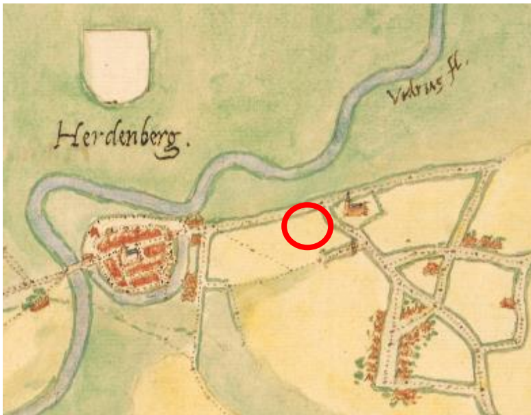
1. Uitsnede kaart Jacob van Deventer circa 1560 ○ = plangebied

Een nader bureauonderzoek maakt echter duidelijk dat binnen het plangebied geen vroegere bebouwing is geweest. Op de kaart van Jacob van Deventer (circa 1560, zie 1)) is geen bebouwing aangegeven.