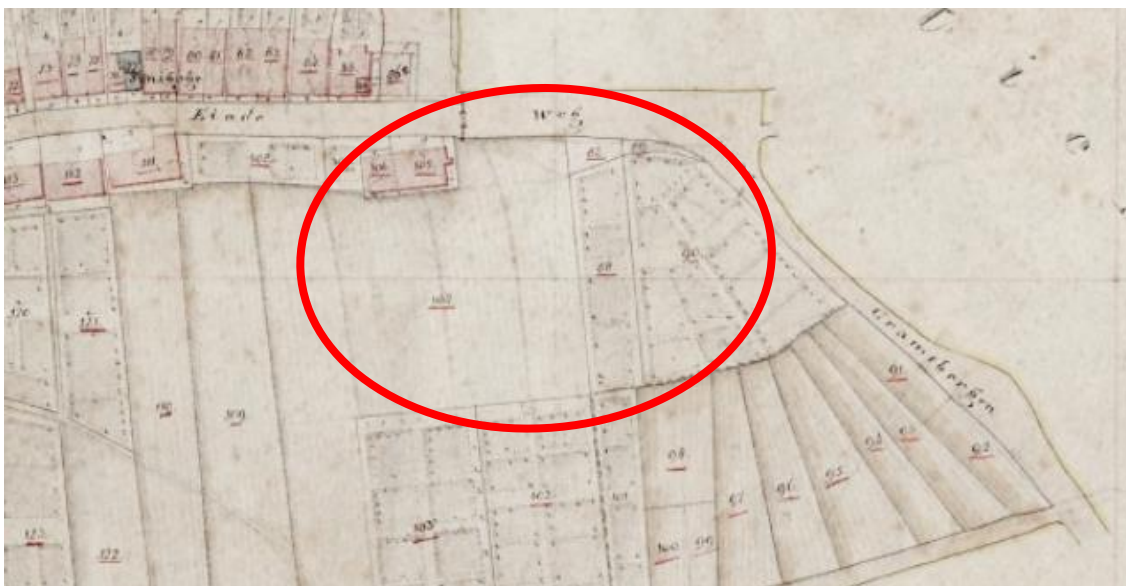
2. Uitsnede kadastrale minuut 1832 ○ = plangebied

Ook op de kadastrale minuut uit 1832 (zie 2) is geen bebouwing aangegeven. De percelen in het plangebied zijn in gebruik als tuin en bouwland, in bezit van verschillende eigenaren. De nummers 105 en 106 zijn beiden huis en erf en in bezit van Derk Zweers Bz (kleermaker te Hardenberg).