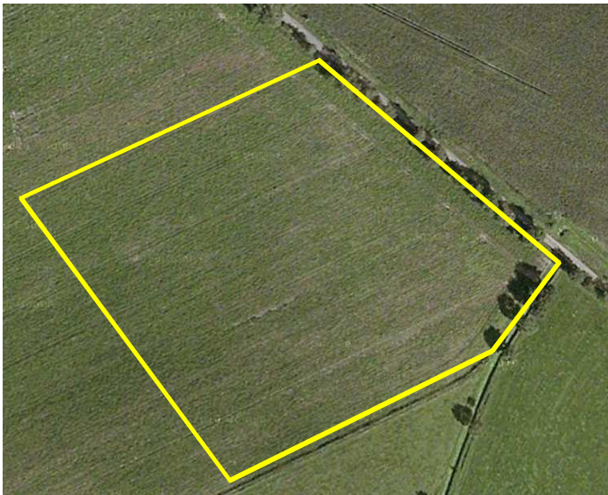
Detailopname van het onderzoeksgebied; deze wordt met de gele lijn aangeduid.

Het onderzoeksgebied bestaat volledig uit agrarische cultuurgrond; tijdens het onderzoek in gebruik als maisland. Opgaande beplanting, bebouwing en open water ontbreken in het gebied. Het gebied grenst aan alle zijden aan agrarisch cultuurland. De Peppelweg vormt de noordwestgrens van het gebied. Op onderstaande luchtfoto wordt het onderzoeksgebied in detail weergegeven.