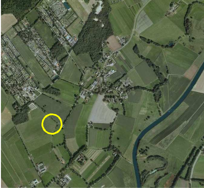
Situering van het onderzoeksgebied. Deze wordt met de gele cirkel aangeduid.

Het onderzoeksgebied is gesitueerd aan de Peppelweg (ongenummerd) in Rheeze. Het ligt in het buitengebied, ca. 1 kilometer ten zuidwesten van de kern Rheeze. Op onderstaande luchtfoto wordt de globale ligging van het onderzoeksgebied weergegeven met de gele cirkel.