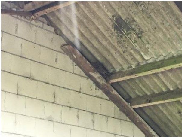
Oud nest van de houtduif in één van de te slopen schuren.

Het plangebied vormt functioneel leefgebied voor verschillende vogelsoorten. Sommige vogels benutten het plangebied als foerageergebied en er nestelen vermoedelijk ieder voorjaar vogels in de bebouwing. Vogels kunnen nestelen op balken en nissen in de muren en in/op opgeslagen materialen en voertuigen. Vogelsoorten die mogelijk in het plangebied nestelen zijn houtduif, merel, winterkoning, koolmees, pimpelmees, gekraagde roodstaart en witte kwikstaart. Er zijn tijdens het veldbezoek geen huismussen in het plangebied of op de omringende erven waargenomen. Verder nestelen er geen huiszwaluwen of boerenzwaluwen in het plangebied en er zijn geen aanwijzingen gevonden dat steen- of kerkuil een rust- of nestplaats bezet in de gebouwen. Rustplaatsen van uilen zijn doorgaans eenvoudig vast te stellen aan de hand van schijfsporen, braakballen en ruiveren onder de rustplaats.