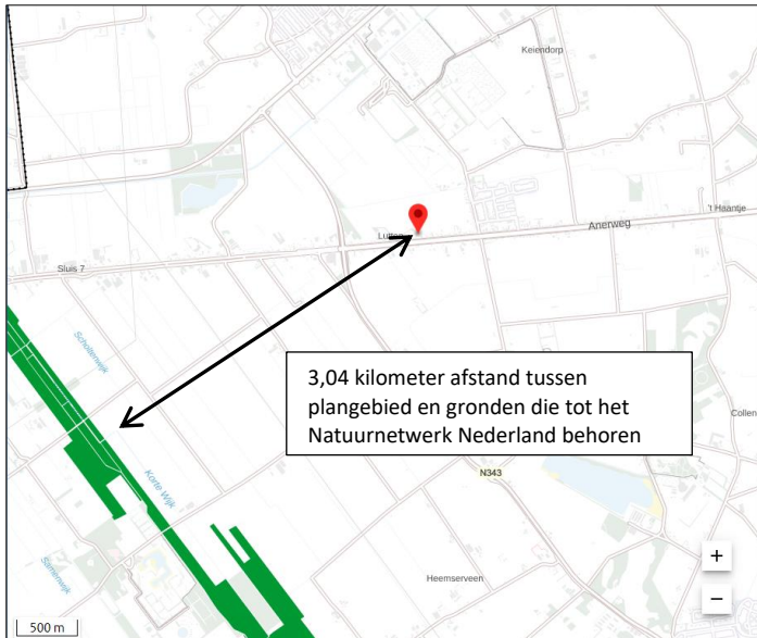
Ligging van Natuurnetwerk Nederland in de omgeving van het plangebied. De ligging van het plangebied wordt met de rode marker aangeduid. Gronden die tot het Natuurnetwerk Nederland behoren worden met de donkergroene kleur op de kaart aangeduid.