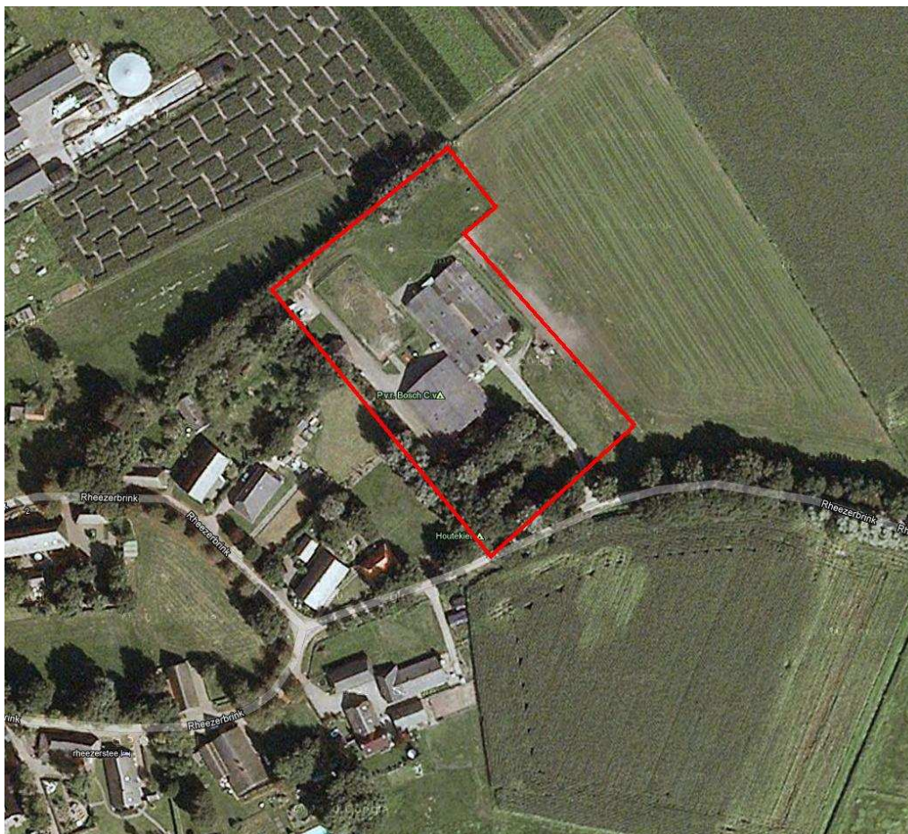
Figuur 1: De ligging van het plangebied met de stallen, rood omljnd. (Luchtfoto: Google Earth).

De stallen zijn gelegen aan Rheezerbrink 7a te Rheeze (gemeente Hardenberg) in de provincie Overijssel. In figuur 1 is een luchtfoto van het plangebied weergegeven.