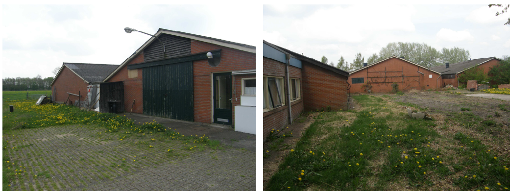
Figuur 2: Impressie van het plangebied.

Het perceel bestaat uit de stallen en bijbehorende gebouwen met daaromheen weiland bestaand uit Engels raaigras. Aan de zuidkant van het perceel groeien tevens een aantal eiken.