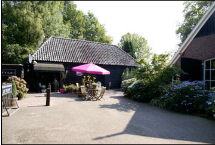
figuur 4: Op het erf staat tevens een oude schuur die behouden blijft