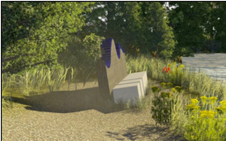
Figuur 12: Een voorbeeld voor een bijzondere bank in het nabijgelegen natuurgebied.

Aan de overzijde van de Vecht ligt het recent aangelegde natuurgebied de Mölnmarsch. Door dit gebied loopt een wandel/fietsroute waarvan intensief gebruik wordt gemaakt door recreanten. Aangezien initiatiefnemer geen ruimte heeft om een volwaardige Kwaliteitsimpuls Groene Omgeving op het erf te realiseren, is in overleg met de gemeente Hardenberg gekozen om een tweetal zitelementen in het natuurgebied te plaatsen voor algemeen gebruik. In overleg met de Gloepe, de gemeente en het waterschap kan een tweetal van deze zitelementen gerealiseerd en geplaatst worden op een nader te bepalen plek.