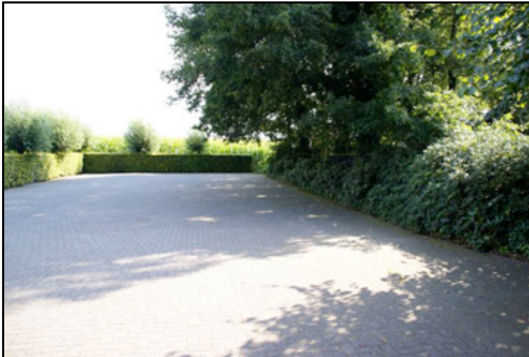
figuur 5: Op het zij-erf is de parkeerplaats, rechts de locatie van het nieuwe hotel