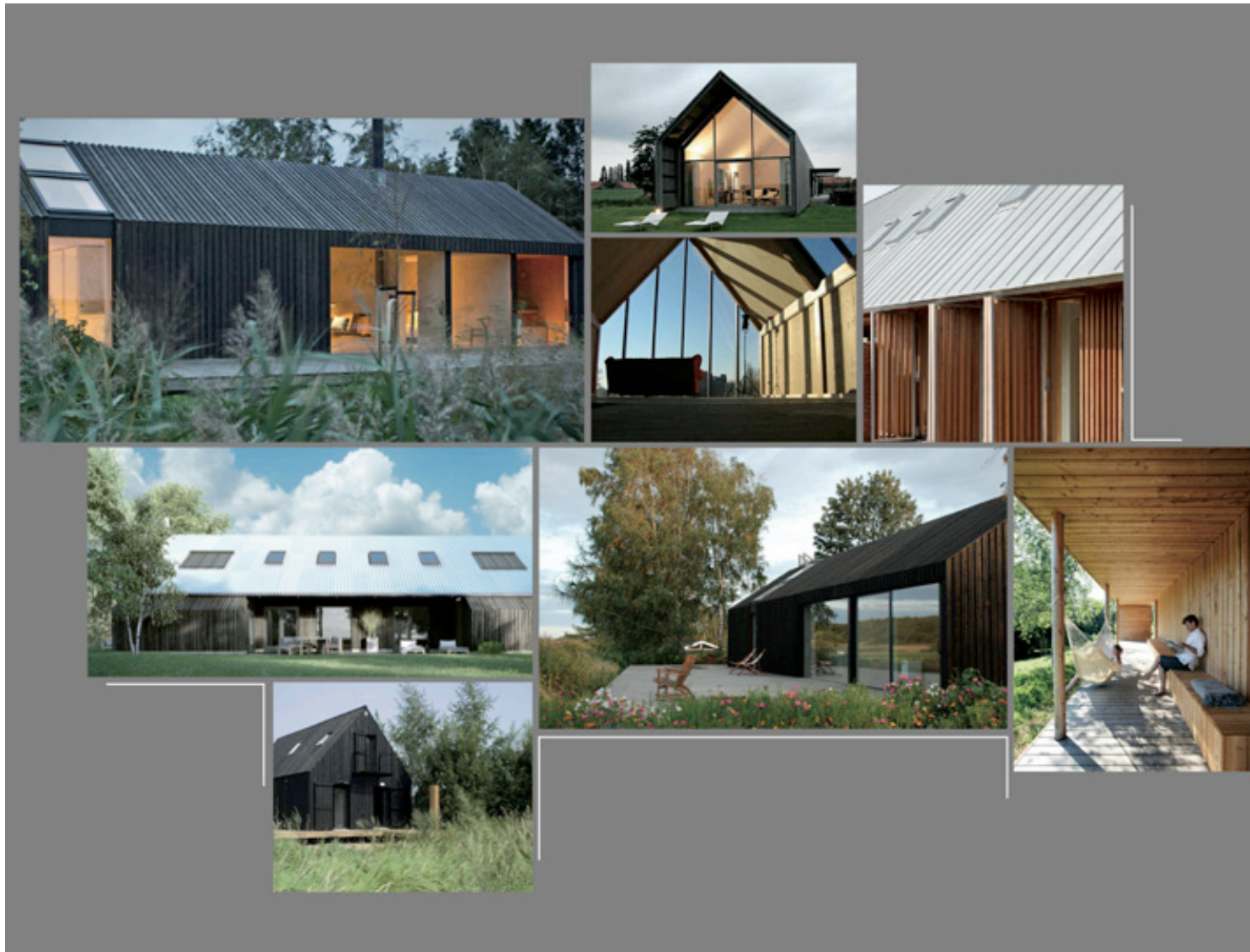
Figuur 11: De sfeerbeelden geven een impressie van bovengemiddelde architectuur voor de bouw van het hotel. Het model schuurwoning spreekt de opdrachtgever erg aan. Geïnspireerd door oude bouwstijlen maar gebouwd in een moderne jas wordt het nieuwe hotel een bijzondere verschijning op het erf. De gekozen architectuur zal een impuls voor de omgeving zijn. Het gebruik van duurzame materialen als hout, staal en plaatmateriaal geven het gebouw een representatieve uitstraling. Naast het gebruik van deze materialen zal het gebouw deels voorzien worden van glas. Deuren, raamkozijnen en windveren zullen geen tevens in een gekleurde kleurstelling uitgevoerd worden. Hierdoor is het hotel ondergeschikt aan de bestaande boerderij die als hoofdgebouw op het erf aanwezig is.