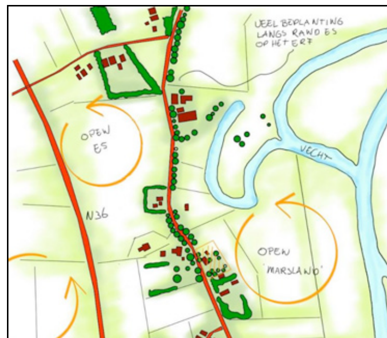
Figuur 9 Landschapsstructuurkaart

Het gebied kent een sterk agrarisch karakter door de openheid en het gebruik van de gronden in het gebied. De erven in het gebied liggen vrij besloten en geclusterd het landschap. De gaafheid van het landschap en de aanwezigheid van veelal oude karakteristieke bebouwing op erven maakt het landschap bijzonder. Binnen deze opdracht is daarom extra aandacht besteed aan de karakteristieke erfopbouw en de architectuur van de bebouwing op de erven.