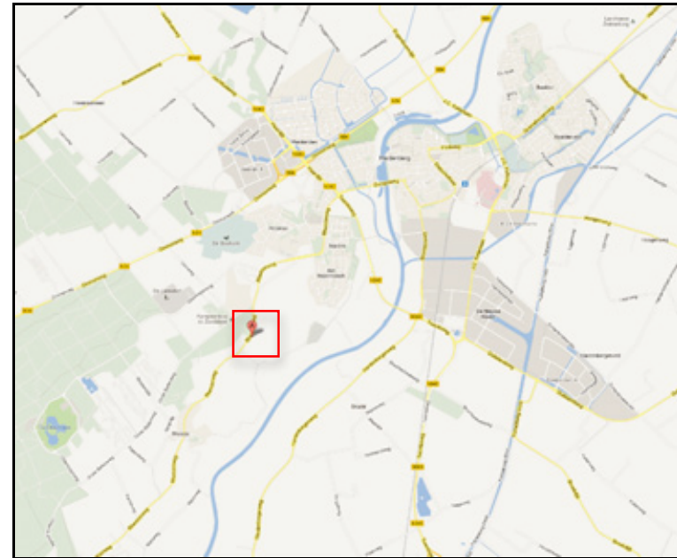
Figuur 1 Ligging plangebied: topografische situatie

Het plangebied is gelegen aan de zuidwestzijde van Hardenberg en is ontsloten via de Rheezerweg. Het bestaat uit een oude boerderij (restaurant) met een schuur (interieurwinkel).