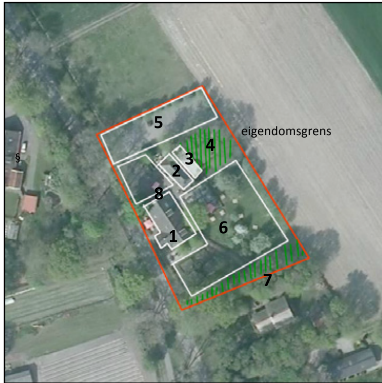
Figuur 2: Bestaande indeling erf Rheezerweg 84a