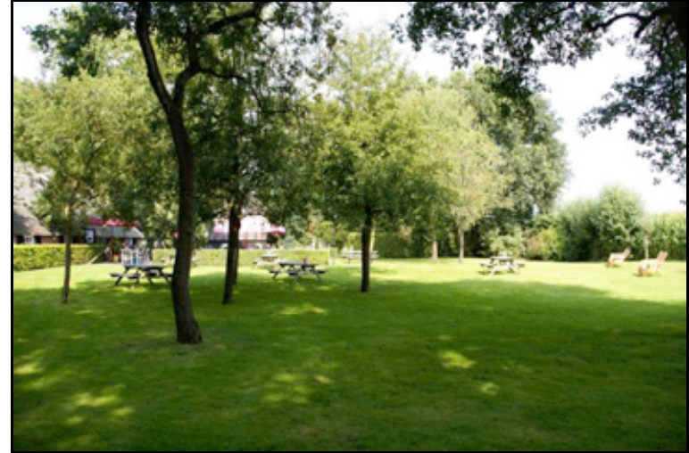
figuur 6: Momenteel staan er op het erf enkele weinig vitale fruitbomen