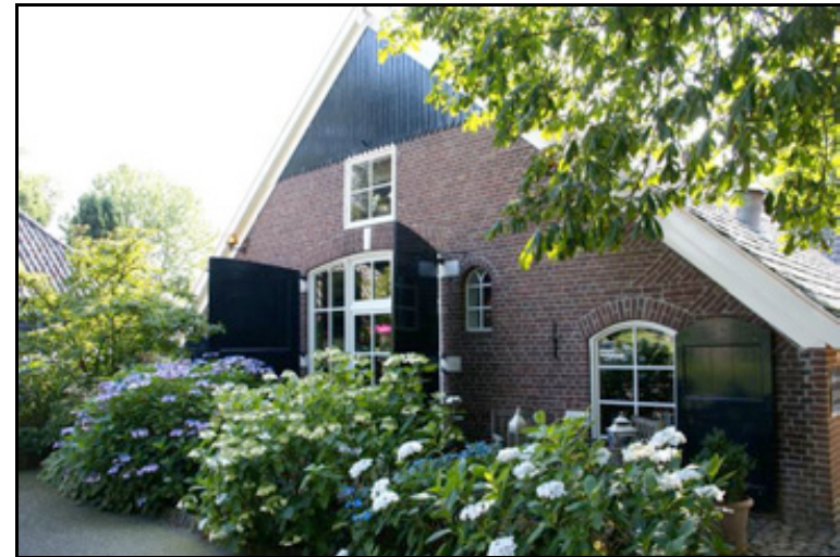
figuur 3: Het restaurant is gevestigd in een fraaie oude boerderij