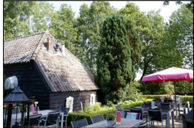
figuur 7: Op het erf staan nog enkele gebiedsvreemde beplantingsvormen