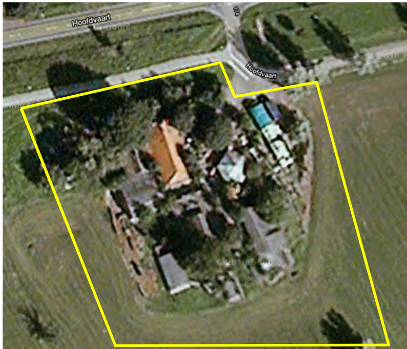
Detailopname van het plangebied. Het plangebied wordt met de gele contour aangeduid. Alle bebouwing in het plangebied wordt gesloopt.