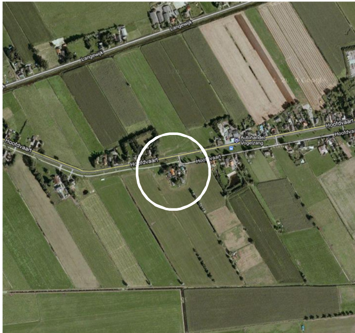
Situering van het plangebied in de omgeving. Het plangebied wordt met de cirkel aangeduid.

Het plangebied is gesitueerd aan de Hoofdvaart 192 in Dedemsvaart. Op onderstaande afbeelding wordt het plangebied in haar omgeving weergegeven.