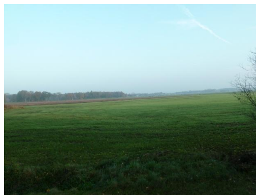
Afbeelding 3 zicht op de omgeving.