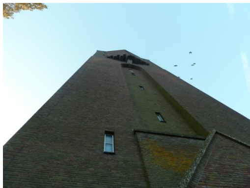
Afbeelding 2 watertoren met enkele kauen.