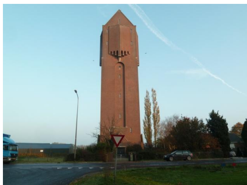
Afbeelding 1 de aanwezige watertoren.

Onderstaande foto's geven een impressie van het plangebied en de directe omgeving: