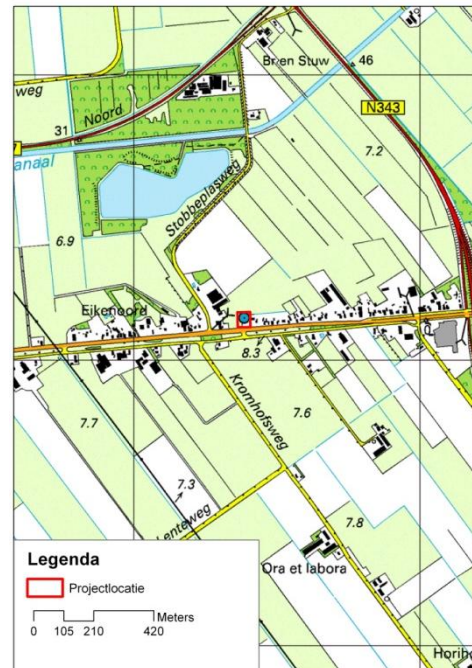
Figuur 1b: Projectgebied en ruimere omgeving