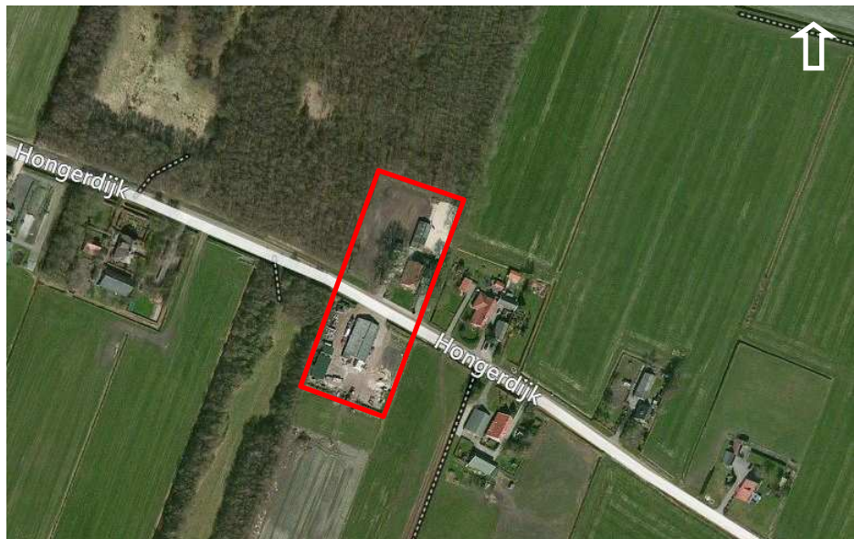
Figuur 1: Ligging van het plangebied (binnen de rode begrenzing).

Het plangebied kan grofweg in twee delen worden gesplitst. Het noordelijke deel betreft een erf aan de Hongerdijk 16 met een woonhuis, enkele schuren, erfbepanting en enkele eiken. Ten zuiden van de Hongerdijk ligt een perceel met een tweetal schuren en omringend grasland (figuur 1). De plannen bestaan uit de sloop van alle opstallen (m.u.v. de woning), nieuwbouw van een bedrijfsruimte in het noordelijke deel en aanleg van een paardenbak in het zuidelijke deel. In het noordelijke deel worden daarnaast enkele forse eiken gekapt. Permanent oppervlaktewater is aanwezig in een sloot langs de westkant van het zuidelijke perceel. Hier vinden echter geen werkzaamheden plaats.