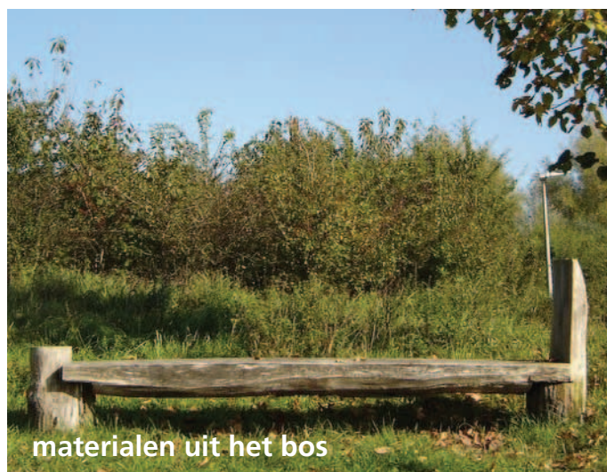
materialen uit het bos