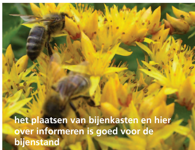
het plaatsen van bijenkasten en hier over informeren is goed voor de bijenstand