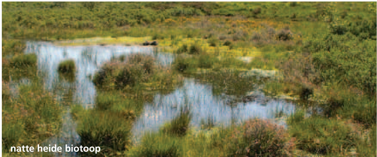
natte heide biotoop

“HET VERSTERKEN VAN DE NATUUR IS ÉÉN VAN DE BELANGRIJKSTE ZAKEN VOOR DE KLASHORST, HET CREEËN VAN ALLERLEI BIOTOPEN ZAL HIERVOOR ZORGEN”