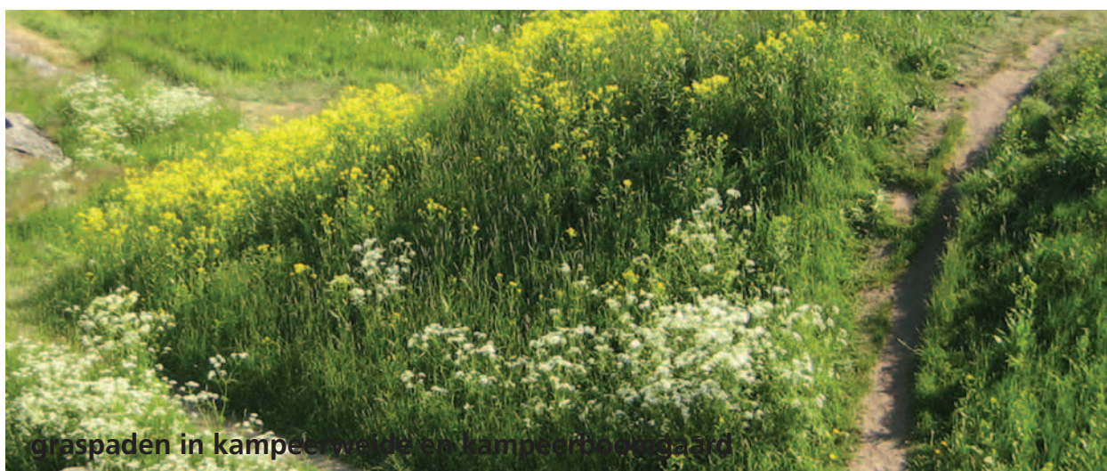
graspaden in kampeerweide en kampeerboomgaard