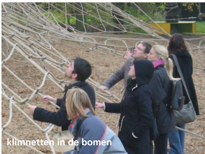
klimnetten in de bomen