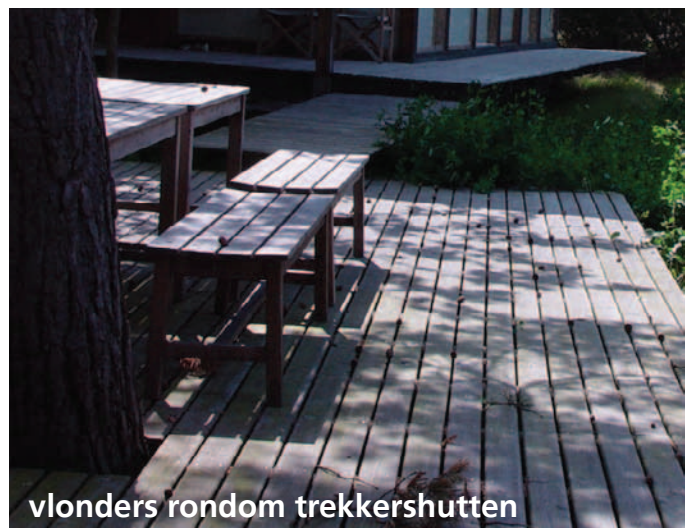
vlanders rondom trekkershutten