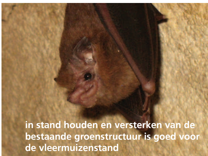
in stand houden en versterken van de bestaande groenstructuur is goed voor de vleermuisstand