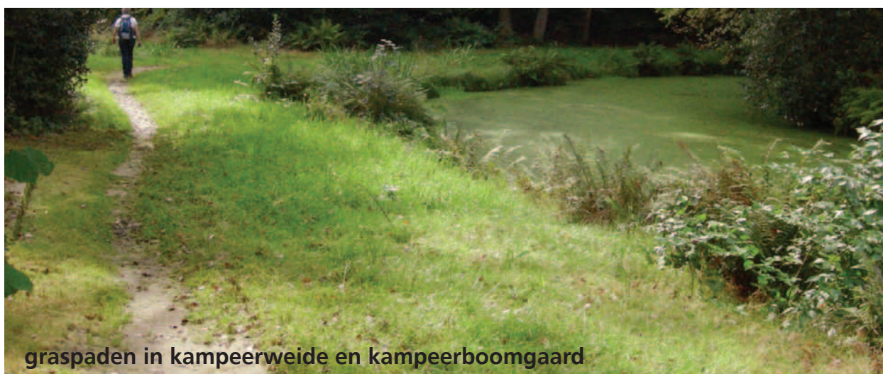
graspaden in kampeerweide en kampeerboomgaard