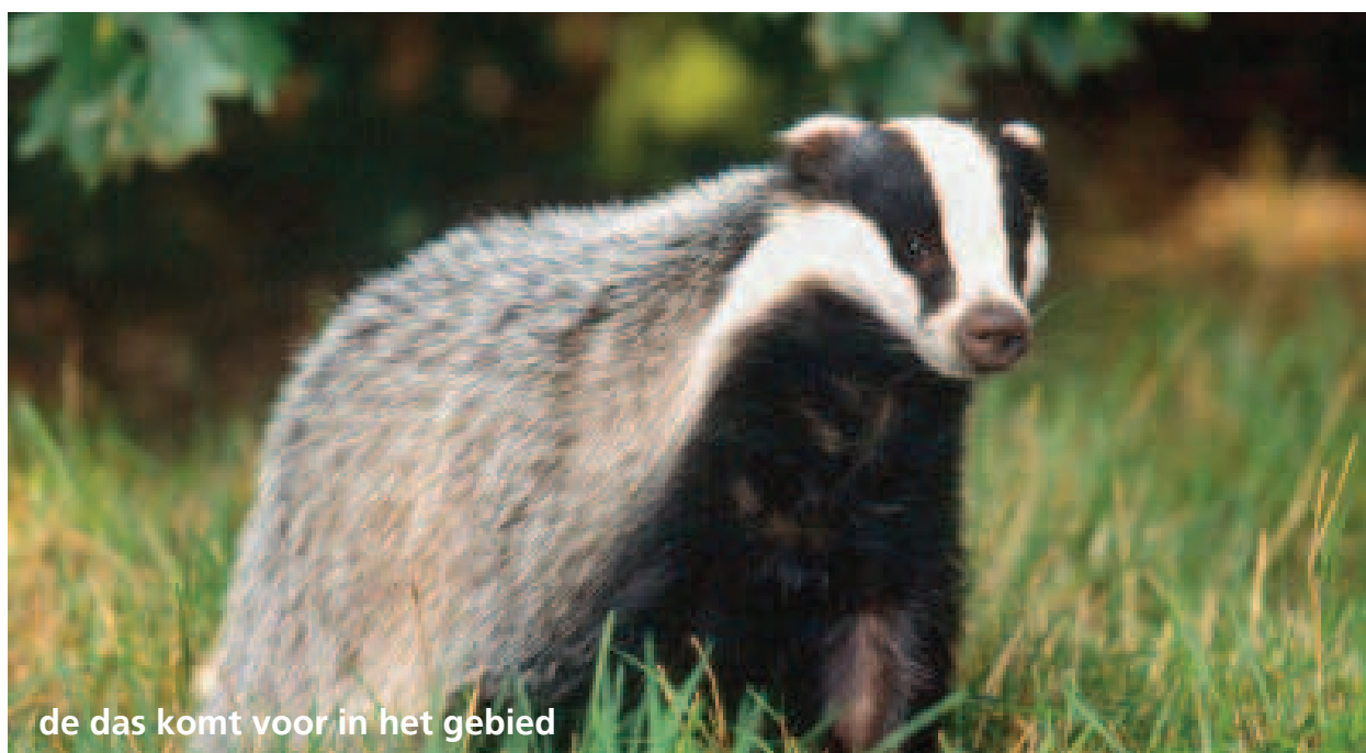
de das komt voor in het gebied