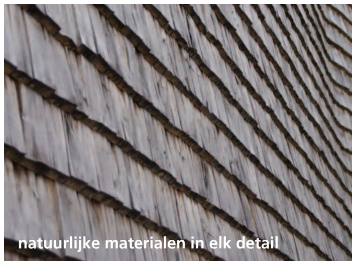
natuurlijke materialen in elk detail