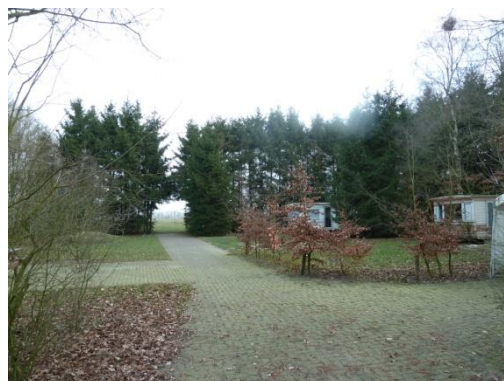
Afbeelding 3: Het campinggedeelte