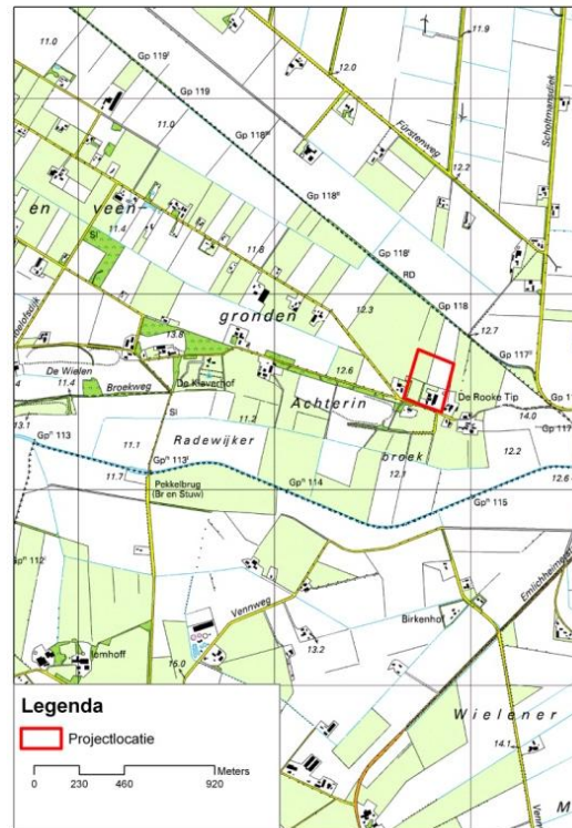
Figuur 1b: Projectlocatie en ruime omgeving.