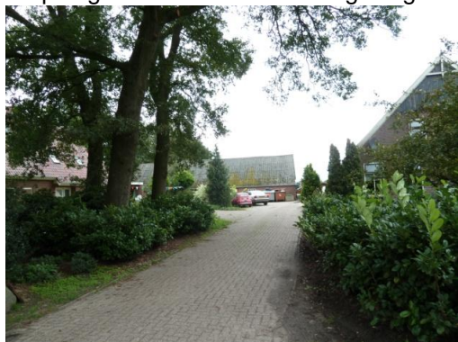
Afbeelding 1: Overzicht van het erf

Onderstaande foto's geven een impressie van het plangebied en de directe omgeving: