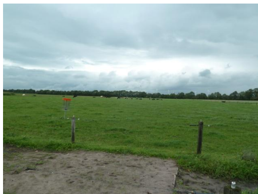
Afbeelding 2: Noordkant van de projectlocatie.