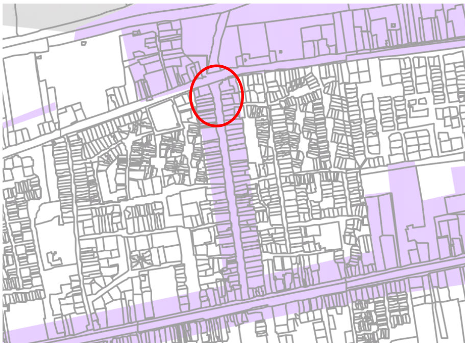
Uitsnede gemeentelijke archeologische beleidskaart