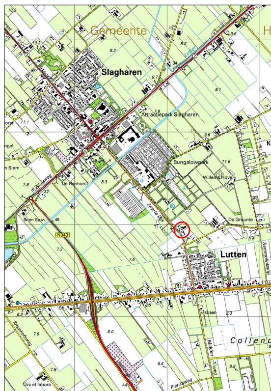
Figuur 1. Ligging projectlocatie (rode cirkel).

Het onderzoek heeft bestaan uit een visuele inspectie van het plangebied en de te slopen gebouwen en het raadplegen van vrij beschikbare verspreidingsgegevens van beschermde dier- en plantensoorten.