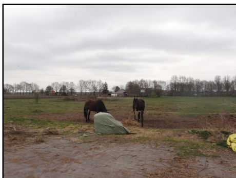
Foto 1 en 2. De te behouden schuur (boven) en het weiland waar de nieuwe woning wordt gerealiseerd (onder).