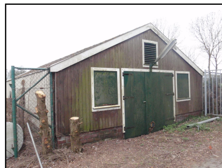
Foto 3, 4 en 5. De te slopen schuren. Boven: beide schuren met op de voorgrond de grote schuur, midden: voorzijde grote schuur, onder: voorzijde kleine schuur.