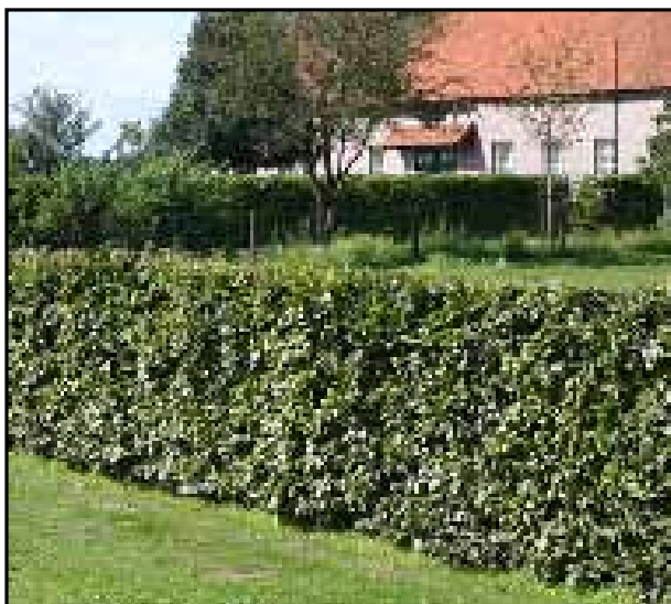
Beukenhaag geeft landelijk karakter